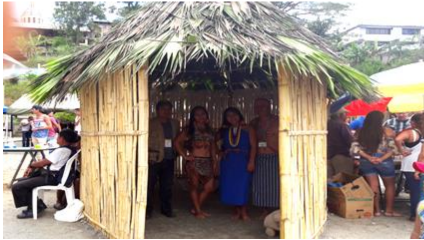
Fotografía 3.1. Turismo Comunitario de la comunidad Shuar de Kayamás. Feria Turística, Gastronómica y del Cuy en Gualaquiza