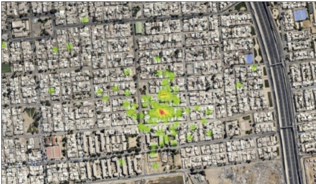
Mapa 1. Estadística geoespacial generada por un sistema de detección de disparos