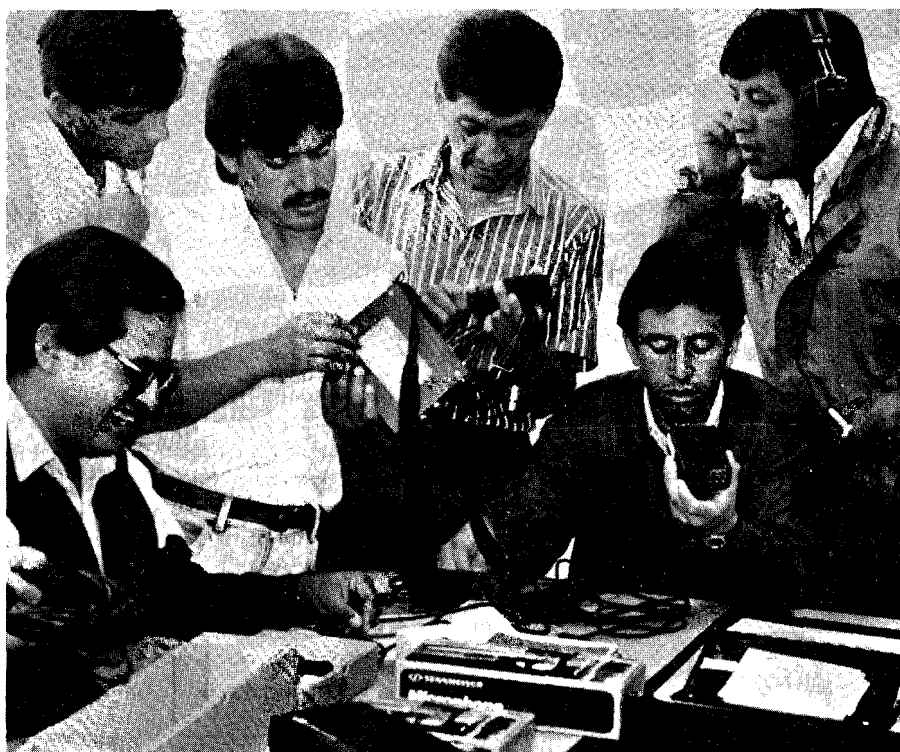
CIESPAL está desarrollando una moderna metodología de enseñanza de TV

El Director del Noticiero Ecuavisa, de Ecuador, plantea los pro y los contras de una opción de integración televisiva en América Latina, cada vez menos utópica.