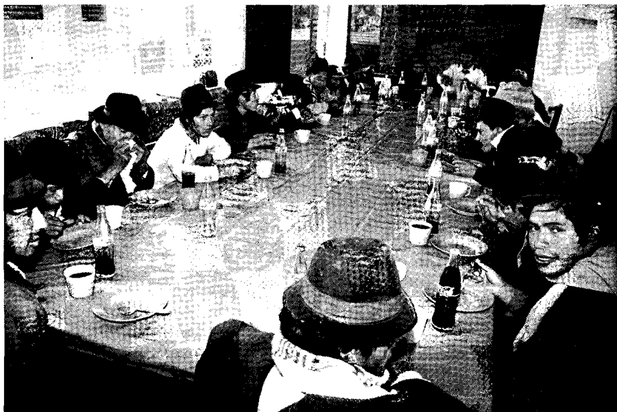
La "civilización" englobó diversos estilos occidentales

Este conjunto "nosotros" también es algo exclusivo , en la medida en que todos los autores insisten que este con-