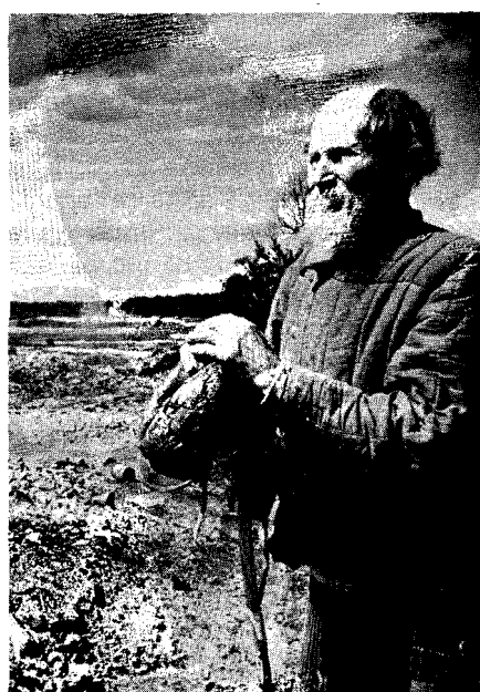
Solamente en Rusia existen más de 40 conflictos interétnicos

Separar Crimea de Ucrania; restablecer la República de Gorsk dentro de Checheno-Ingusia, la Osetia del Norte, Kabardá y Cherkesia; restablecer la au-