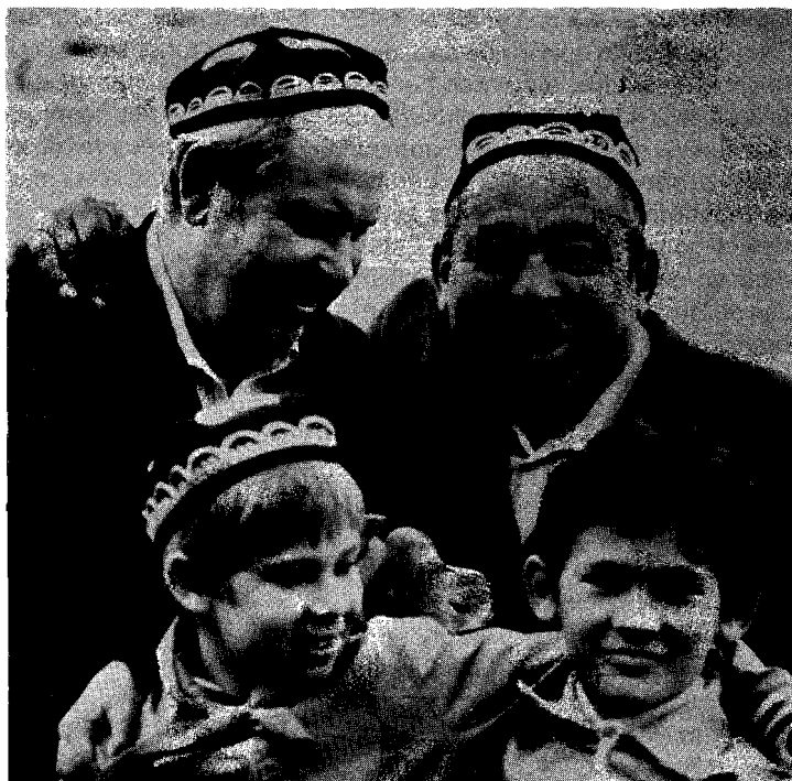
El nuevo Tratado de Unión deberá incluir un documento análogo entre los pueblos interétnicos

La agencia soviética de prensa Novosti reduce sus operaciones en América Latina. Esta es su última entrega exclusiva para CHASQUI. Duro análisis del problema de las nacionalidades en la Unión Soviética. ¿Existe un intento de desmembrar a Rusia? ¿O se está pagando por años de incomunicación?