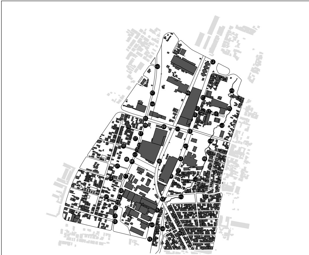
Ilustración 1. Localización de tácticas planeadas en el Área Industrial Mixta Quitumbe - Morán Valverde