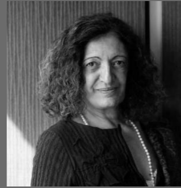
Ana Falú (ARGENTINA)