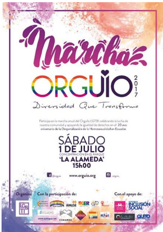
Ilustración 4.1. Marcha ORGUÍO 2017. Diversidad que transforma