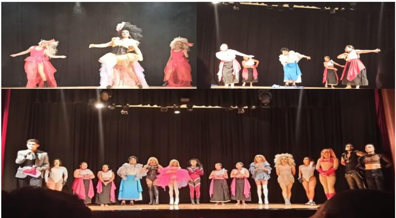
14 de mayo de 2022

Considero que esta heterotopía sexo-genérica se presentó bajo la forma de una queerización o LGBTización del espacio porque no se hizo alusión al término ‘marica’. El modo en el que se cuestionó y subvirtió el espacio fue a través del arte, en un ámbito privado y arancelado. Considero que, la presentación artística en un espacio privado permitió que transitar en el sistema binario sea aceptado por la universidad, a diferencia de los momentos en los cuales hubo censura por parte de lxs directivxs al observar cuerpos disidentes tomarse el espacio público. Esto trajo consigo reflexiones sobre la población LGBTIQ+ e incluso disidencia