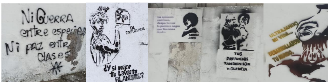
1 de abril de 2022.