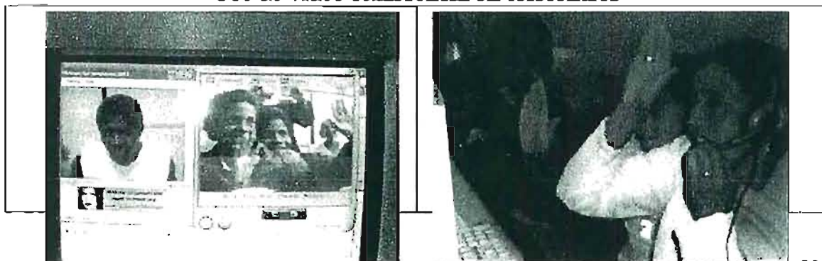
GRÁFICO No. XII Uso de video conferencia en telecentros

Se pudo observar que el telecentro de Cuenca (ver fotos) es el que mejor funciona en relación a la temática migratoria. A decir de los propios usuarios que han empezado a utilizar Internet como medio de comunicación con sus parientes en el exterior, consideran que este medio “es mejor porque no solo le escucho sino también le veo” (ML, cuenca).