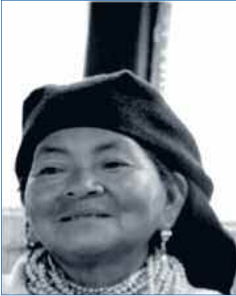
Moradora de San José de Cocotog

cotidianamente en Cocotog. La familia se está desarticulando y uno de los motivos reside en que muchos padres de familia salen a trabajar a la ciudad y los/as hijos/as a estudiar. Las mingas familiares para el trabajo de la tierra han desaparecido; ahora solo se dedica un número mínimo de horas al sembrío y son las madres quienes han asumido este trabajo que antes era comunitario: