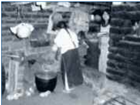
Cocina tradicional de una pareja de adultos/as mayores de San José de Cocotog

“(…) Apertura de vías y todo eso ha venido un poco de desarrollo productivo y económico, pero también tiene sus consecuencias estar propensos a robos, delincuencia, y a costumbres urbanas, también drogas y alcoholismo (Hombre, 28 años, 2011)”.