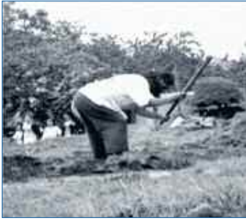
Mujer de Cocotog preparando la tierra

ticas fisiológicas en la mezcla de lo blanco y lo indio, proveniente de la conquista española a las tierras latinas indígenas. Como resultado, el proceso del sentido de pertenencia a lo mestizo se originó con los proyectos políticos dominantes, por ende la construcción de las ciudades y de la urbe también contiene el proyecto ideológico del mestizaje como visión civilizadora y ordenadora de la barbarie de la cultura indígena.