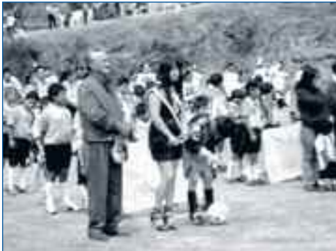
Inauguración de la Fiesta de San José de Cocotog