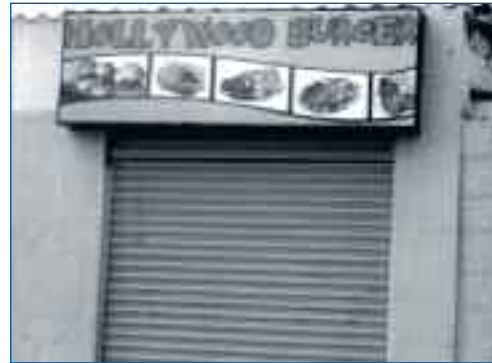
Restaurante de comida rápida

“(…) El arroz comprando en Quito o hay veces que vienen a vender acá, pasa un carro por aquí que sabe vender, como ahora hay muchos carros antes no había mucho carros, nosotros sabíamos ir al Inca levantando a las 4 y media (…) de ahí sabíamos coger los distintos carros para el trabajo, aquí no había nada ahora hay camionetas, buses, antes era a pura pata como ni servía el camino y había un carrito, en ese tiempo era todo lodo, antes no había la carretera y teníamos que ir por un bosque que era puro piedras cargados zambo, zapallos así veníamos, aquí da zambo, chochito (Historia de Vida, mujer, 81 años, 2011)”.