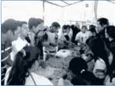
Misa Mantana jóvenes de San José de Cocotog

espacio social, otros cuartos que servían de habitaciones y la cocina independiente.