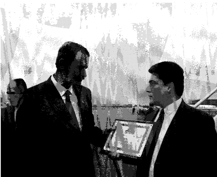
Fox sigue en campaña

El elector no es un consumidor. La política no es un producto sujeto a lo voluble de los gustos de los consumidores. La política es responsabilidad de largo alcance, y los medios tienen que entenderlo. Para ello, los medios y consultores tendrán que redefinir sus horizontes, aún más teniendo en cuenta que el 2006 ya no está lejos en el ánimo político de la sucesión presidencial. Publicidad y marketing funcionan para los productos, no para las ideas políticas. ●