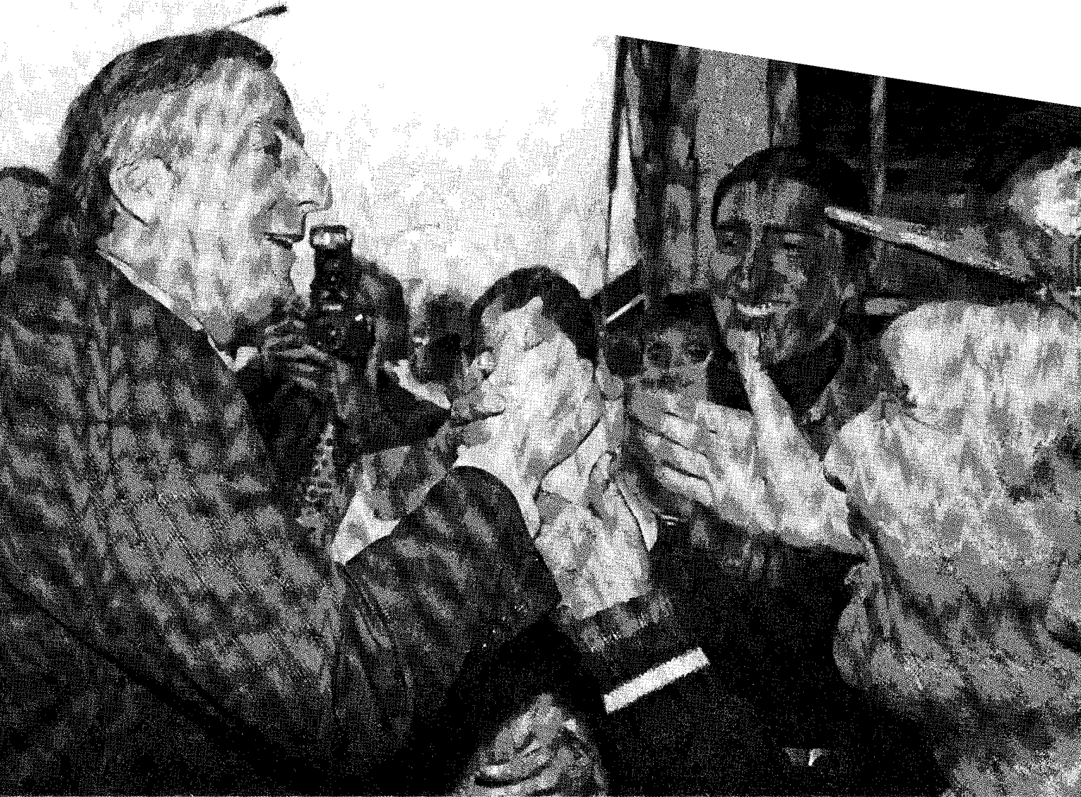
Kirchner realizó una campaña a la "antigua"

Canal 9 de TV abierta) que se mantuvieron firmes en su apoyo más o menos evidente a Carlos Menem. Más allá de las suspicacias de las que por otra parte nunca hay pruebas, es interesante señalar que la autopercepción del periodismo argentino es tradicionalmente más hacia la izquierda que la propia población. Siendo Menem un peronista muy volcado hacia un neoconservadurismo de raigambre regañiana, y con el consabido desgaste que lleva el ejercicio de la máxima magistratura durante más de diez años y la circunstancia que los tres años posteriores a su alejamiento del poder no los utilizó para "reciclar" su imagen deteriorada, ni para "aggiornar" su discurso, era lógico que la fresca progresista de Néstor Kirchner atrajera mayores simpatías.