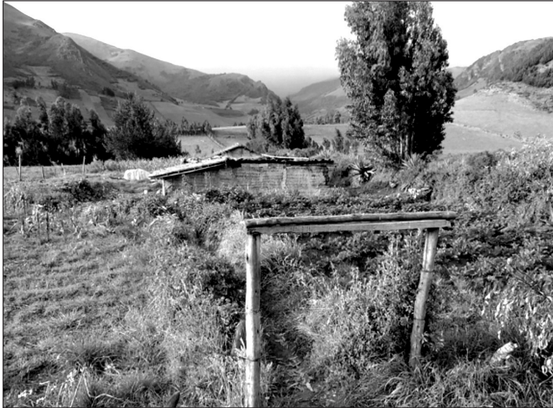
Foto 1. Pequeña parcela destinada a cultivos para autoconsumo (papas y cereales). Comunidad La Chimba (Cayambe)