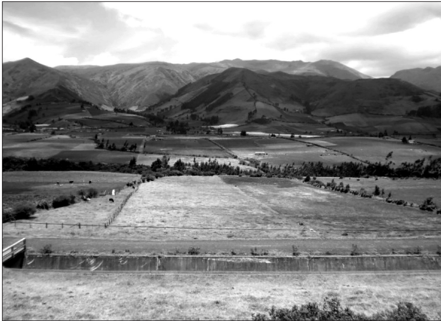
Foto 2. Paisaje rural de la comunidad La Chimba, Cayambe (parcelas lecheras)

El segundo aspecto también es identificable en la zona de investigación. A partir del inicio de la agricultura bajo contrato, existe un peso creciente de la figura asociativa como forma organizativa referente, en detrimento de la figura de la “comunidad” tradicional. Las lógicas individuales se han sobrepuesto a las lógicas de acción colectivas y esto debilita, en gran medida, la continuidad del proceso de reproducción de “sentimientos de pertenencia y similitud” entre las agriculturas familiares de la zona. Existe un debilitamiento notorio de las prácticas tradicionales de reciprocidad y solidaridad (tales como formas de trabajo colectivo “minga y prestamano”, y el intercambio de productos agrícolas bajo forma de trueque o “uniguilla”). Este hecho favorece, como señalan Hernandez y Phélinas (2012), una recomposición profunda de las relaciones sociales favorables a la supervivencia de la pequeña agricultura y da paso al fortalecimiento de nuevas lógicas idealizadas por las nuevas generaciones, como parte de las cuales las aspiraciones individuales se alejan cada vez más del campo y de la agricultura.