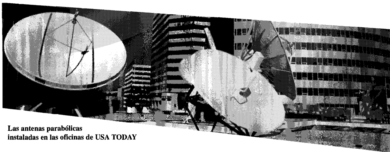
Las antenas parabólicas instaladas en las oficinas de USA TODAY

Hoy, a pesar del precio del papel, a pesar de los altos costos de distribución y producción, los periódicos siguen siendo un negocio productivo y las condiciones del mercado se presentan provocativas. Sin embargo, todavía hay razones preocupantes que se presentan como obstáculos. Su atractivo, contenido y crecimiento en el futuro siempre están a prueba,