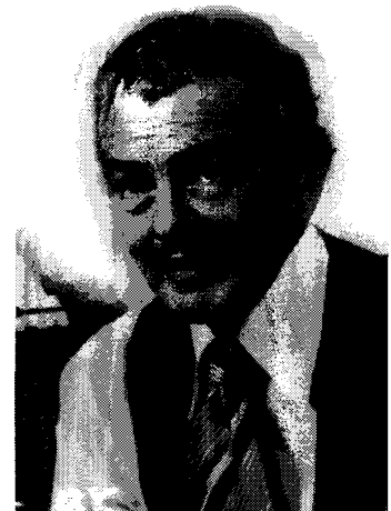
Allen Neuharth, el padre y fundador

A Neuharth se le acusa o se le glorifica, dependiendo de quien le describa, de haber consolidado el negocio de la prensa escrita y de haber conducido al periodismo a atender a la generación criada bajo la tutela de la televisión y apelar al mínimo común denominador de los