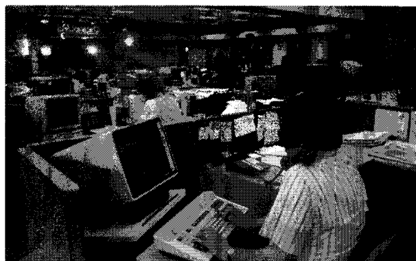
Una moderna sala de redacción

Para nadie es un secreto que hay más gente simple y sencilla que sofisticada e intelectual. USA Today parece haber logrado un compromiso, un balance entre estos dos perfiles, ese es el secreto de su éxito. USA Today cumple 20 años. Durante estas dos últimas décadas, el estado de los medios en general y de la prensa escrita en particular ha venido experimentando cambios radicales, debidos a la competencia