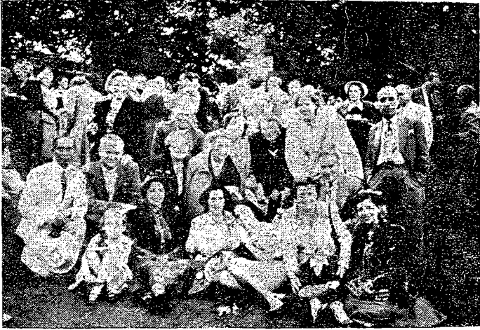
Un aspecto del Picnic a Mountain Lodge, ofrecido a los Delegados de la Conferencia por la Ontario Teachers Association del Canadá

locales, etc.; luchar por las libertades democráticas del Magisterio, poner la Escuela y la Educación al servicio de la Paz, trabajar por el aumento de los presupuestos de Educación y de la Infancia y porque se detenga simultáneamente la fabricación de ingenios de destrucción, sobre todo de bombas atómicas, que amenazan con reducir a la nada todo nuestro trabajo de educación.