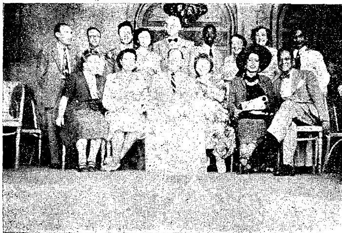
Grupo de Delegados a la Conferencia de Ottawa, después de una sesión de Comité.

Los organismos directivos de la Confederación serán la Asamblea de Delegados, el Comité Ejecutivo y el Secretariado Administrativo. Los idiomas oficiales serán, inglés, francés, alemán y español.