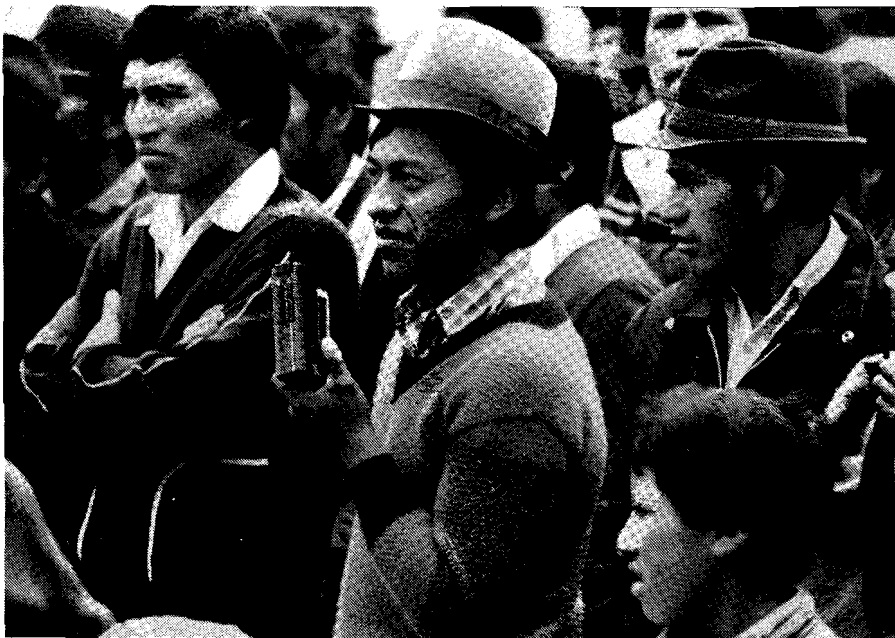
"Un servicio sofisticado para radios comunitarias"