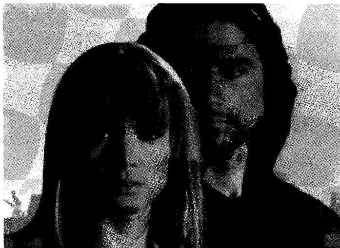
Principales protagonistas de la telenovela

En la telenovela, Lisandro Donoso, mano derecha de Lombardo, sufre un infarto justo en el momento en el que está por declarar y en la realidad, el ex represor de la Escuela de Mecánica de la Armada (ESMA), Jorge Anaya no pudo declarar porque dos horas antes de que tenía que hacerlo le diagnosticaron una cardiopatía grave. Pero sin duda, el hecho que causó más alegría y que terminó por unir a la ficción con la realidad es la aparición del nieto número 85.