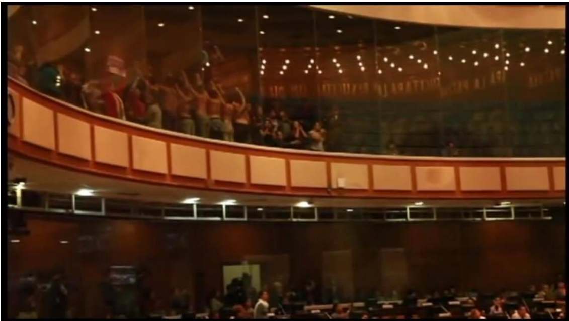
Foto 3.4.: Mujeres de las organizaciones feministas en las barras altas con los torsos desnudos