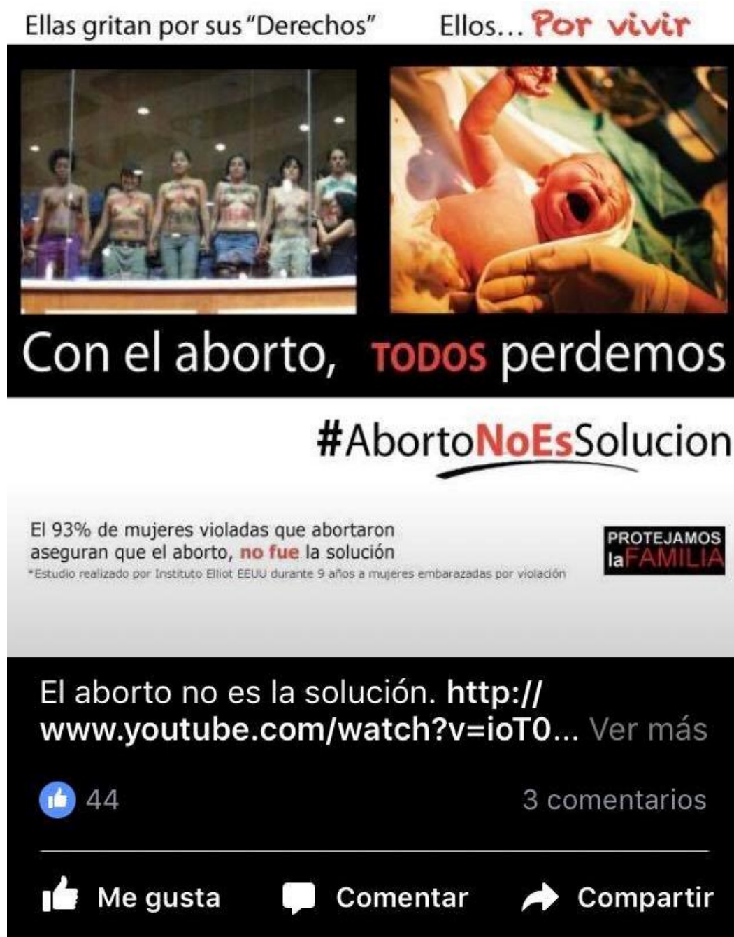
Imagen 3.2.: Publicación del movimiento ProVida en su página oficial de Facebook.

102