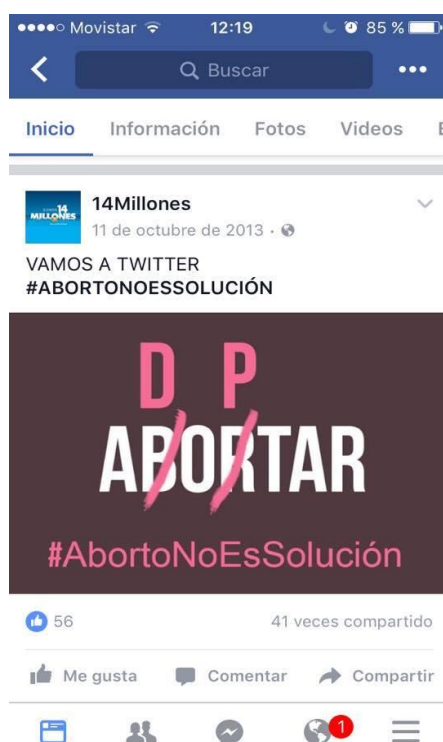
Imagen 3.3.: Publicación de la página oficial de 14 millones.

110