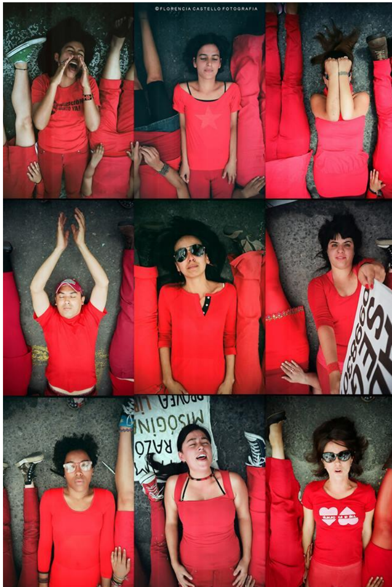
Foto 2.2. “Performance Alfombra Roja Ecuador”.