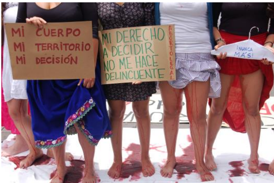
Foto 2.4. “Performance el debate tendido en la calle”.