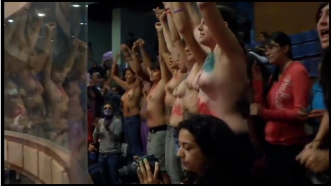
Foto 3.3.: Mujeres de las organizaciones feministas en las barras altas con los torsos desnudos gritando “Aborto legal en el Código Penal”. Fuente: YouTube 125 . Captura de pantalla del video de YouTube colgado por Salud Mujeres.