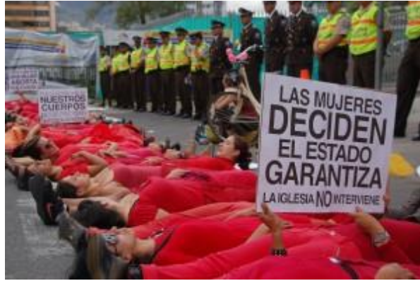
Foto 2.1. “Alfombra Roja Ecuador fuera de la Asamblea Nacional”.

El performance “Alfombra Roja” es una acción que se ha producido en varios países de Latinoamérica. Andrea Zambrano estudió este performance en el marco de cómo las mujeres se valen de sus cuerpos para expresarse. Andrea explica que “Alfombra Roja - Ecuador se desplaza dentro de un cuerpo común aún más grande, [...] Alfombra Roja – Perú, articulada en las experiencias de Alfombra Roja en otros países” (Zambrano, 2015). En este caso, se innova la misma acción de otros países latinoamericanos en Ecuador, en donde solo por ser otro contexto, tiempo y espacio el performance es totalmente diferente a los de otros países. Como dice Tilly “innovan a partir de los repertorios heredados y a menudo incorporan formas rituales de acción colectiva” (McAdam, Tarrow y Tilly 20015, 53).