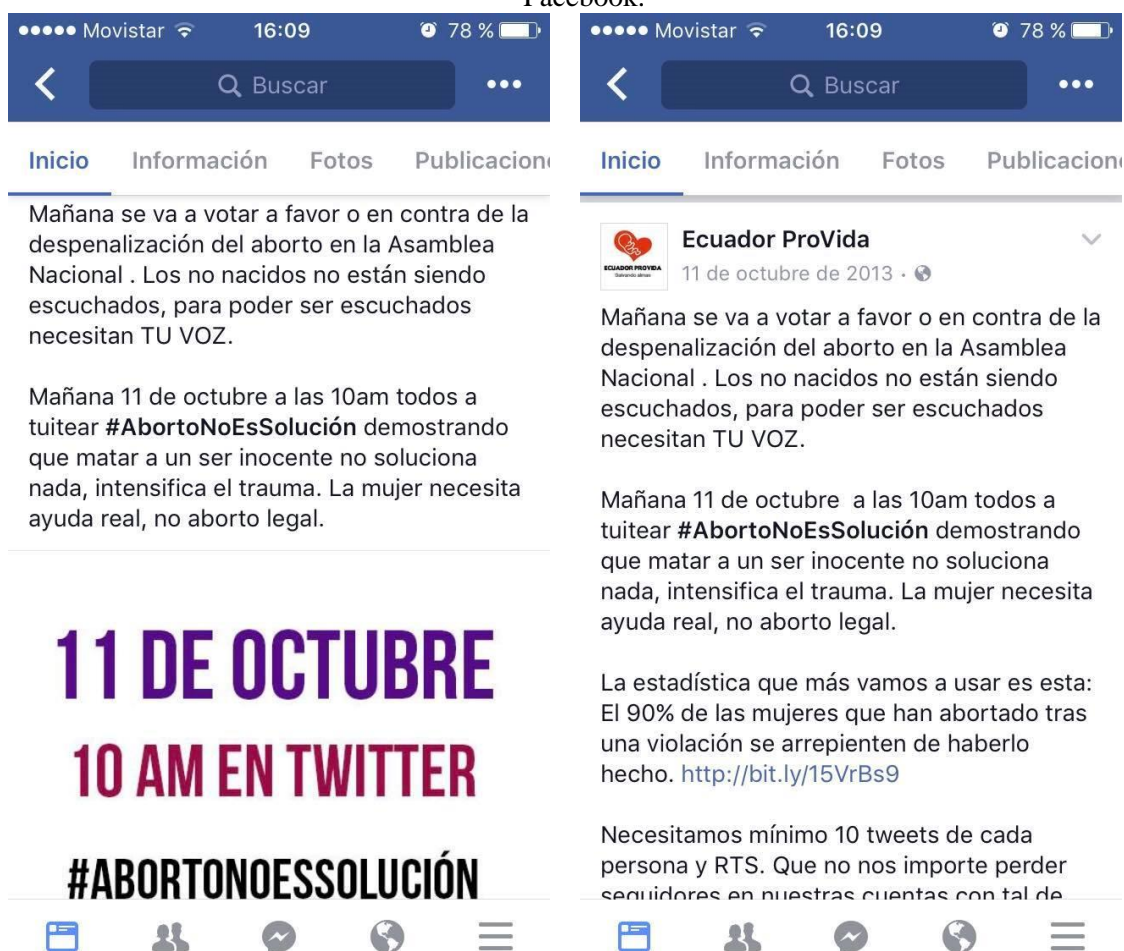
Imagen 3.1.: Capturas de pantalla de la publicación del movimiento ProVida en su página de Facebook.

101