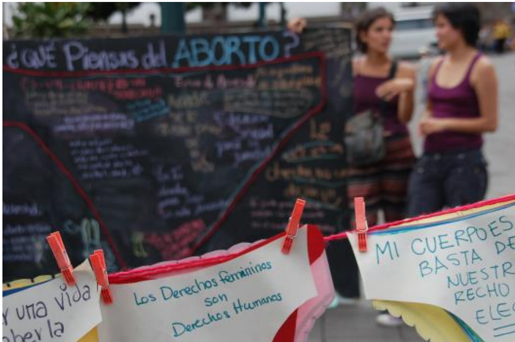
Foto 2.3. “Performance el debate tendido en la calle”.