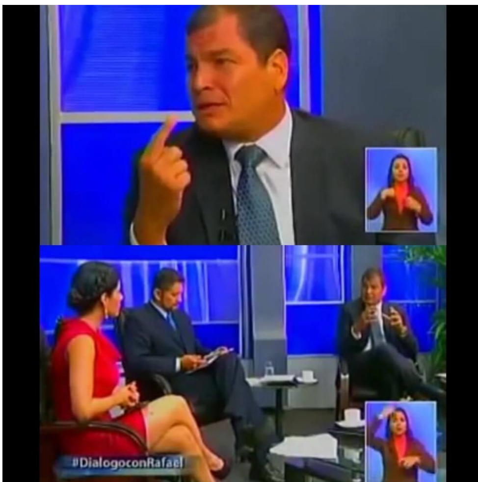
Imagen 3.7. Captura de pantalla de la entrevista a Rafael Correa de Oromar TV.