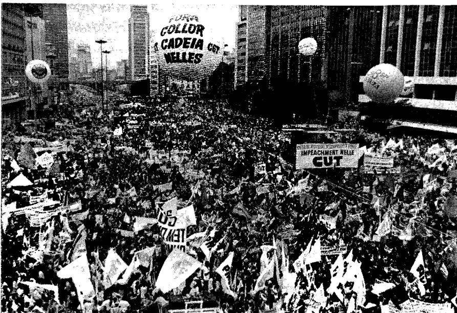
400.000 contra Collor en São Paulo

La bola respondió, tranquila y segura: "Yo soy el orgullo de no tener sentimientos. Soy la inercia primaria del Brasil. No soy la burguesía, ni las clases dominantes. Soy la pasta esencial de la que todo está compuesto. Soy la historia inmóvil de Brasil. Tengo la grandeza de la miopía y la belleza de la mezquindad. Yo soy el feo, el que tiene la sabiduría de los chanchos, la claridad de los roedores, la visión de las ratas. Yo acumulo toda esa sabiduría mientras ustedes se desgastan alimentando esperanzas. Yo no soy la mosca en la sopa. Yo soy la sopa."