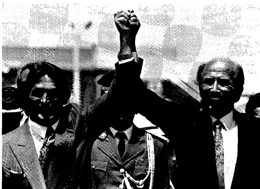
Carlos Andrés Pérez con Jaime Paz Zamora