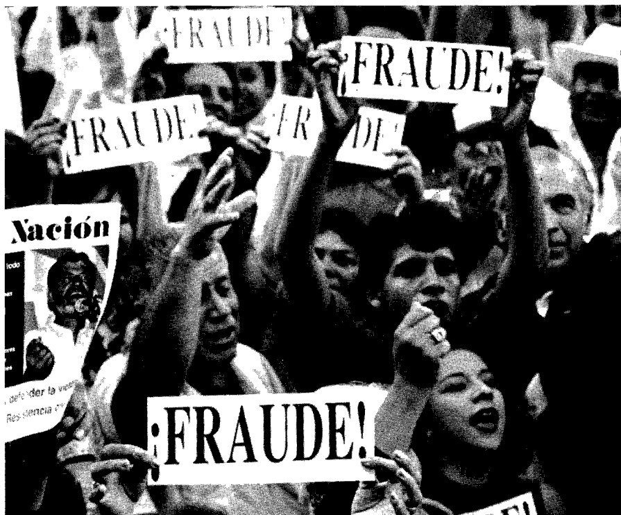
Mitin en San Luis de Potosí, México