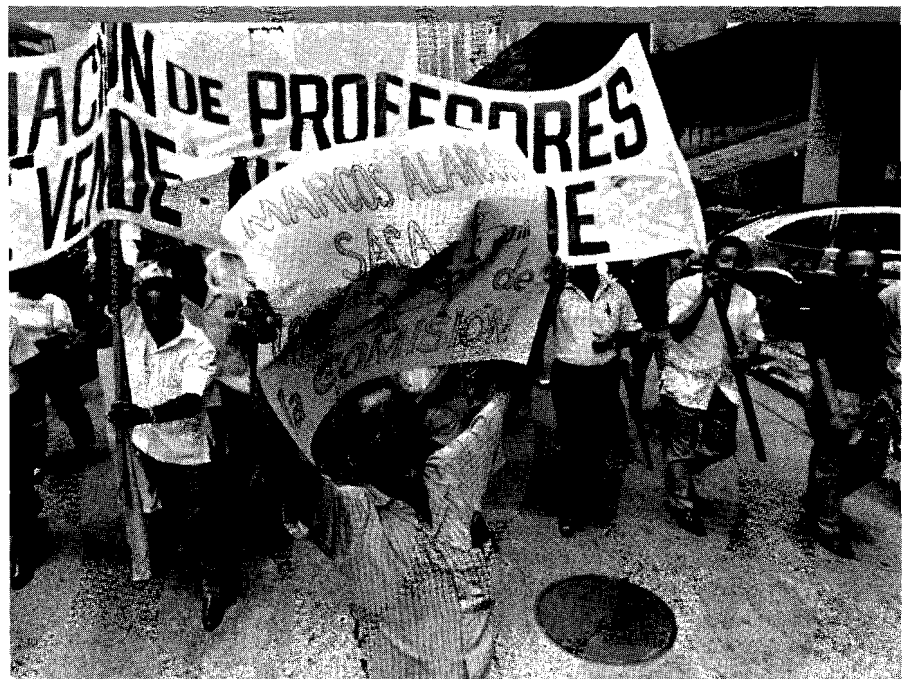
Marcha de profesores contra la política educativa del gobierno

Según el director de El Nacional este aumento del poder de los medios, que se