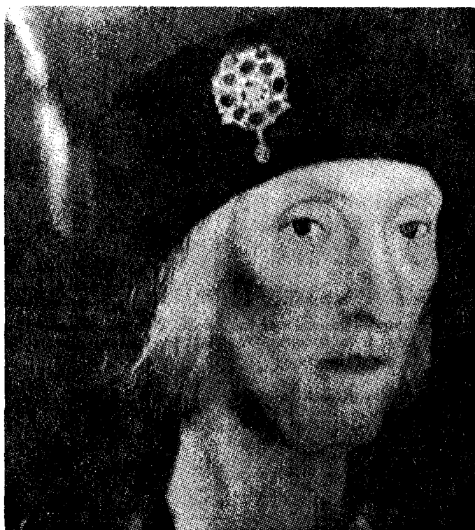
"El Comercio", Ecuador

Para que la posibilidad iberoamericana no se manifieste exclusivamente en la innegable realidad de su presencia física y gane espacio también en la mente de las nuevas generaciones, las autori-