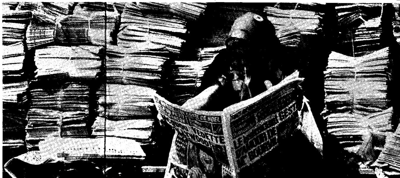
La prensa, en el Golfo, soportó la pre-censura

"Nosotros no podemos decirles a todos ustedes que vengán al campo de batalla", agregó Williams. "Estas son unidades móviles y en algún momento deberán moverse". Aceptó que ha habido momentos en que la escolta de los miembros del "pool" intentó censurar o manejar la cobertura de los reporteros, pero enfatizó que esos intentos son contrarios a la política del Pentágono.