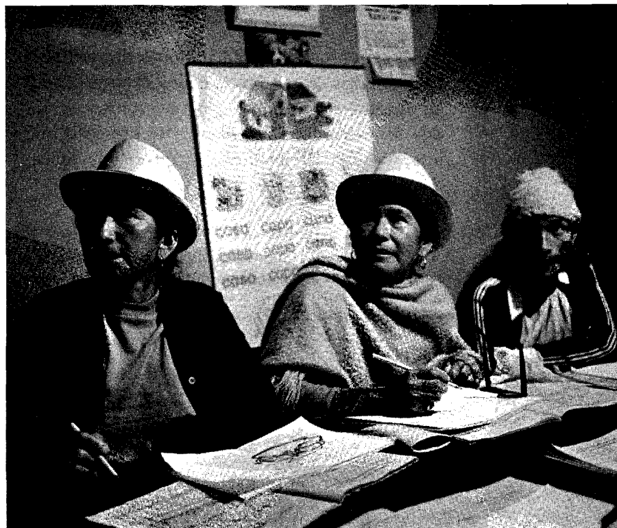
La educación alfabetizadora enfrenta fuertes restricciones presupuestarias

El desafío para el futuro sigue siendo la seguridad del acceso a una enseñanza primaria de calidad aceptable, a la alfabetización y a conocimientos básicos y habilidades esenciales para todos los niños, jóvenes y adultos. Sin embargo, el acceso universal a la enseñanza prima-