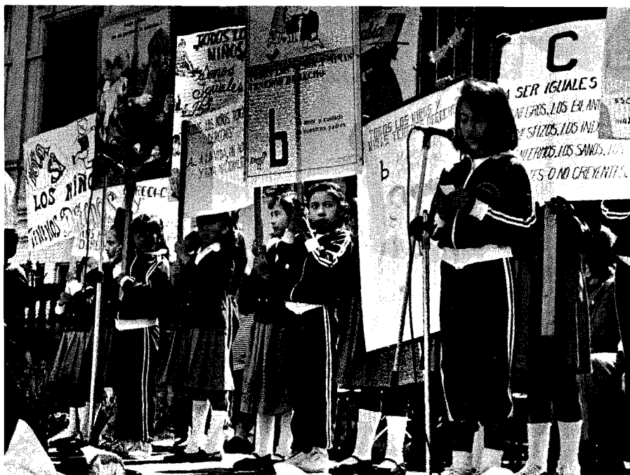
Los medios alimentan a los niños con imágenes importadas

Los datos disponibles indican que los países en condiciones socio-económicas similares tienen niveles diferentes en los resultados de la educación, debido a las políticas y prioridades que afectan a la educación. Este hecho debe alentar a los países a establecer objetivos audaces pa-