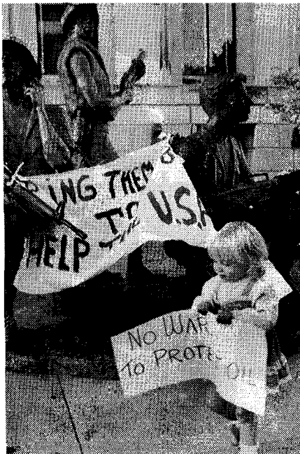
Libros of Our Times

Tercero , los sentimientos de los grupos minoritarios acerca del despliegue de tropas y el uso de la fuerza prueban que son complejos y conflictivos. La idea generalmente aceptada de que los grupos minoritarios apoyaron menos la acción militar, no tuvo eco en los hispanos; y fue significativa entre los negros solamente al principio de la crisis.