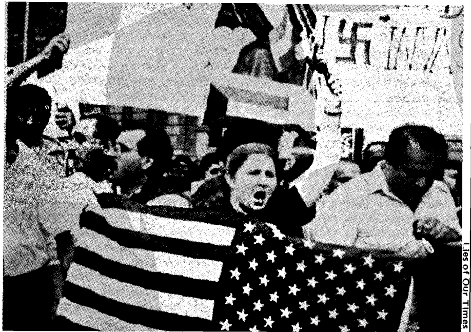
La opinión pública fue desinformada

La guerra del Golfo fue un evento hecho a la medida para los medios. El conflicto fue presentado como un partido de fútbol. De esto se aprovecharon los políticos para moldear la opinión pública a su antojo. Nada tiene éxito como el éxito.