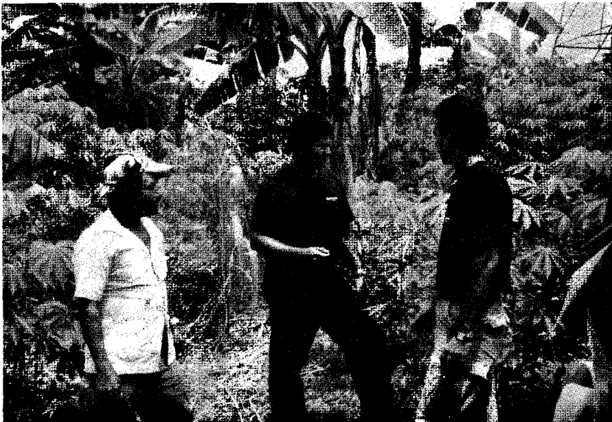
La afectación ecológica, el gran dilema de los especialistas

Obviamente, no existe una estrategia única para enfrentar la multitud de problemas ambientales. Sin embargo, las