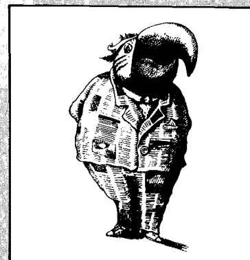
[Revista: Tiempos Nuevos]

Educación y concientización ambiental: Constituyen los pilares fundamentales de cualquier estrategia en favor de un desarrollo sustentable. El esfuerzo coincide con la necesidad general de modernizar los sistemas educativos de la región y obtener el apoyo de los medios de comunicación para formación de una opinión pública favorable.