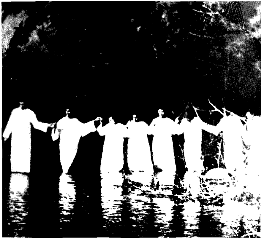
“Memorias del subdesarrollo” de Tomás Gutiérrez Alea (Cuba).