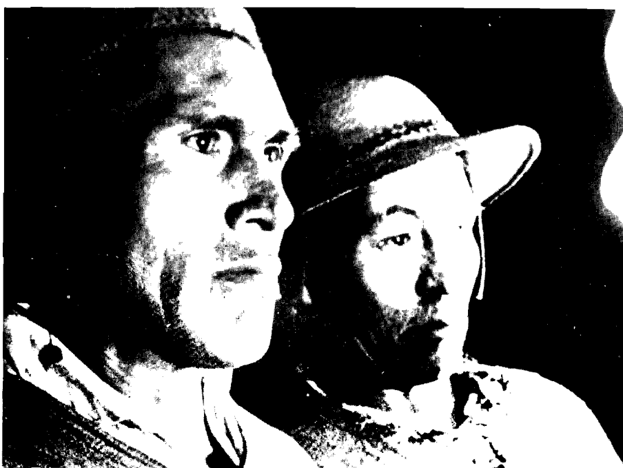
"La sangre del cóndor" de Jorge Sanjinés.

Pretendemos acaso la anulación del autor? La postergación del arte? Todo lo contrario: Creemos que la más alta realización personal nace como producto de la realización colectiva de la sociedad. El problema sólo consiste en cam-