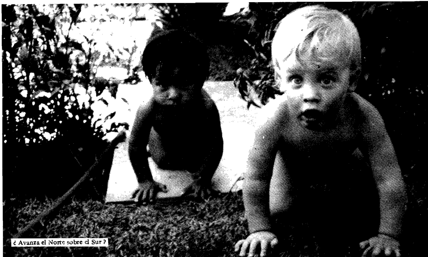
¿ Avanza el Norte sobre el Sur ?