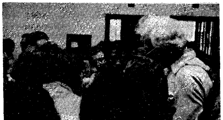
Periodistas asistentes a la reunión de solidaridad mundial con Nicaragua.