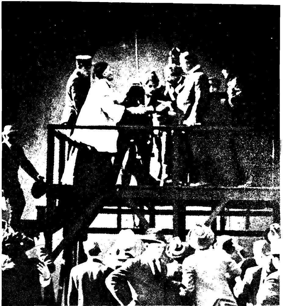
"Intolerancia" (1916), de David W. Griffith: la lucha contra el Mal en estilo barroco.

Ocupando el puesto de esas reencarnaciones de Satán, aparece una lista de monstruos incontrolables, que coinci-