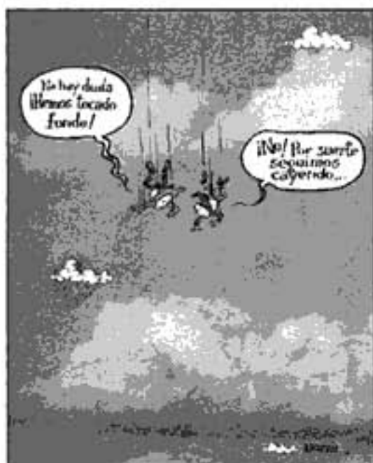
Portada: caricatura Javier Bonilla