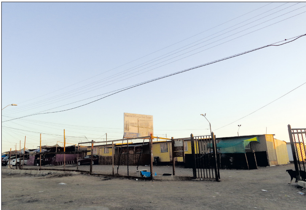
Figura 1. Campamento de emergencia Héroes del Solar (Arica, Chile)

Habitando “no lugares”: subjetividad y capacidades familiares ante un desastre siconatural en Chile