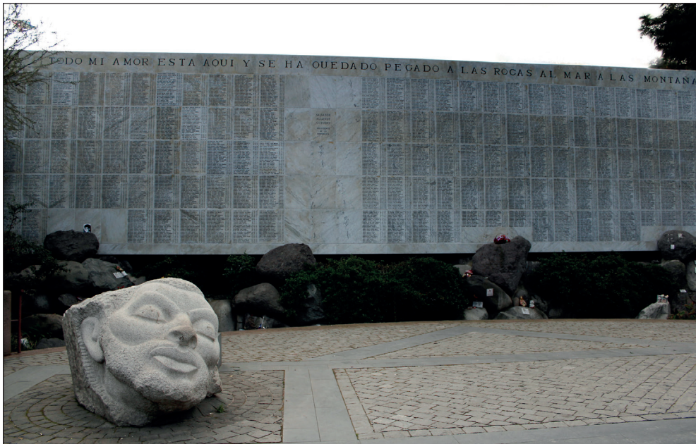
Imagen 1. Memorial Cementerio General, Comuna de Recoleta, Santiago