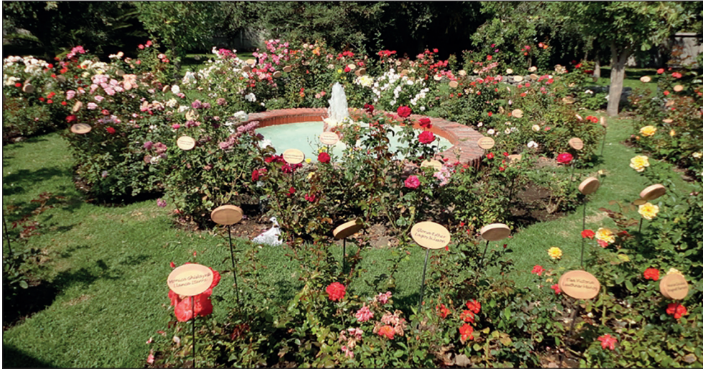
Imagen 2. Memorial Jardín de las Rosas en Villa Grimaldi