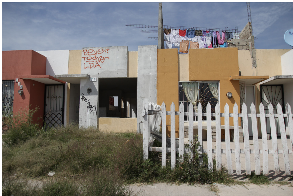
Imagen 3 Vivienda abandonada, Guadalajara, Jalisco