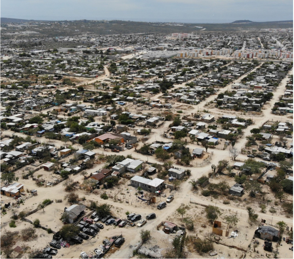
Imagen 1 Crecimiento formal e informal en la periferia de Cabo San Lucas, Baja California Sur