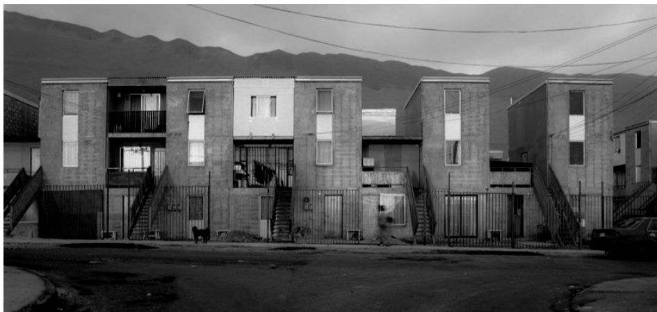
Figura 11: Proyecto Habitacional Quinta Monroy