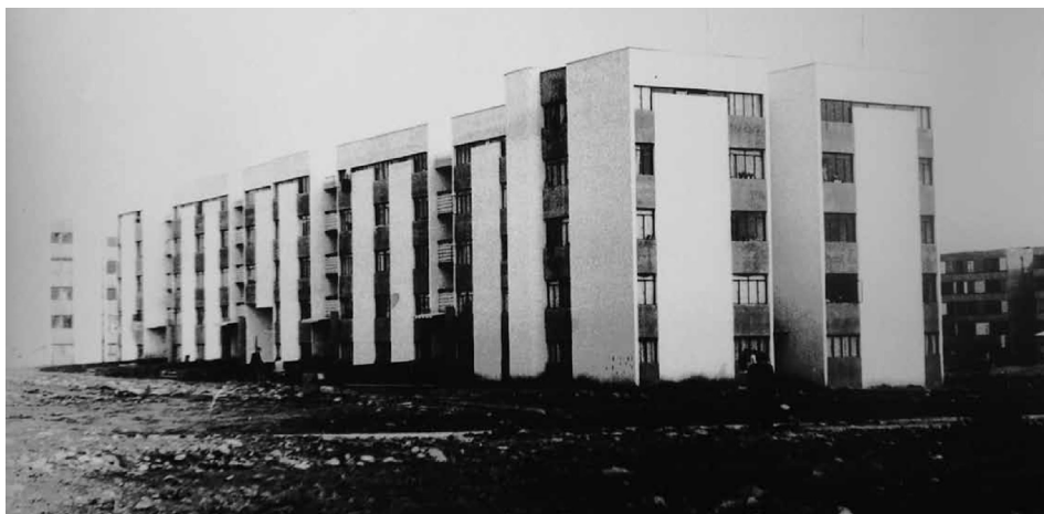
Figura 6: Edificio de 5 pisos sector 6 del conjunto Remodelación San Luis