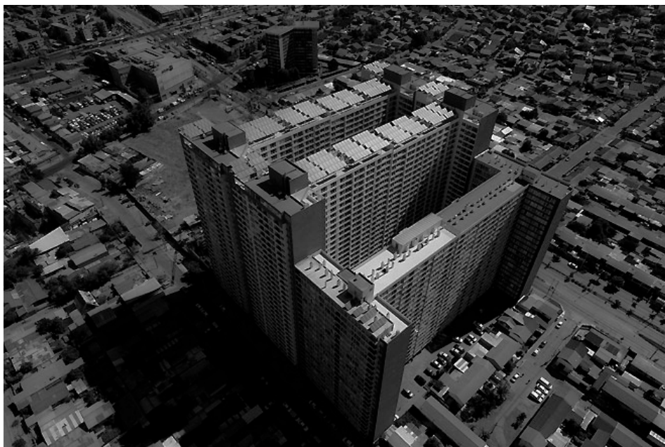
Figura 12: Guetos Verticales Estación Central