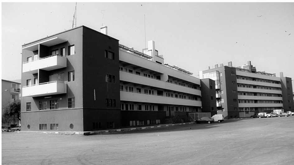
Figura 2: Conjunto Habitacional Caja de Seguro Obrero Obligatorio Antofagasta

En el período 1944 a 1953, la Caja de la Habitación construyó un total de 18.560 viviendas en forma directa y 9.486 viviendas en forma indirecta, 7.128 a través del fomento de la Ordenanza Especial y la Ley Pereira, aportando un total 35.174 viviendas que se sumaron al parque habitacional (CORVI, 1957 en Bravo, 1959). Uno de los ejemplos destacados de esta arquitectura es la construcción de los “Colectivos habitacionales” entre 1939 y 1942 en ciudades del norte del país. Se trata de unos conjuntos de departamentos de 4 y 5 plantas ubicados en Tocopilla, Antofagasta (Fig. 2), Iquique y Arica realizados por la Caja de Seguro Obrero Obligatorio cuyo arquitecto a cargo era Luciano Kulczewski muy reconocido por sus obras de carácter art-nouveau y un temprano racionalismo.