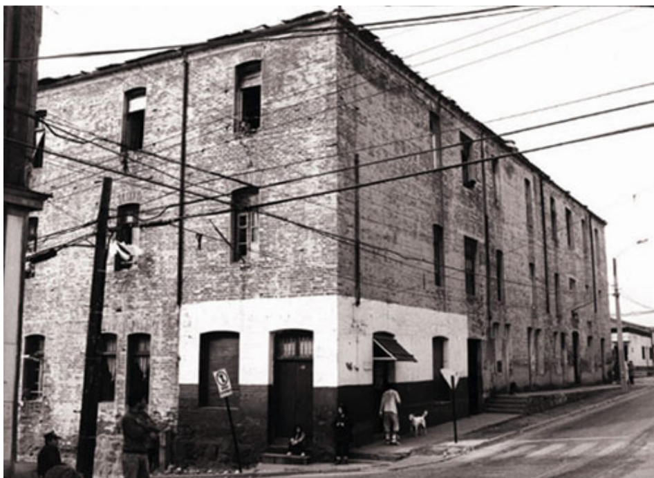
Figura 1: Población Obrera La Unión