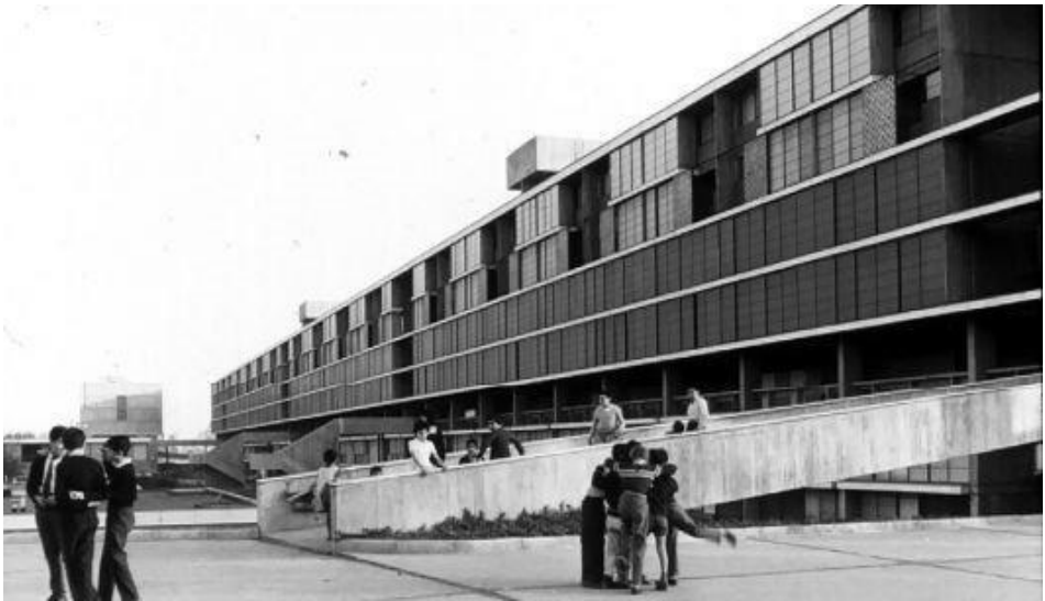
Figura 4: Unidad Vecinal Portales