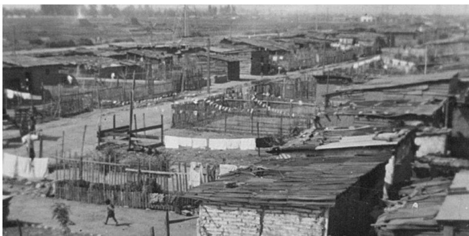
Figura 5: Población la Victoria en 1959