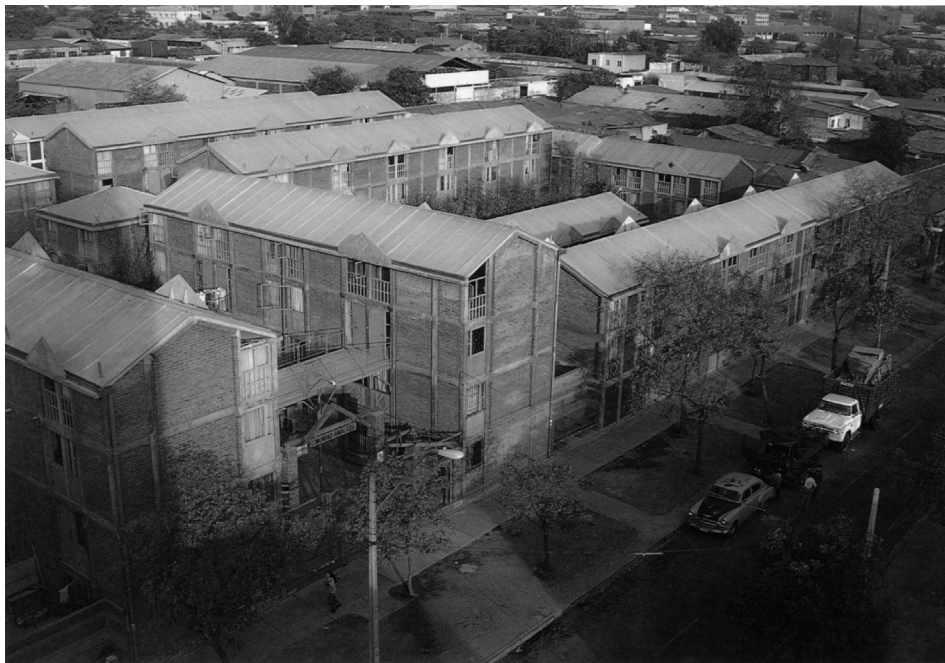
Figura 9: Comunidad Andalucía