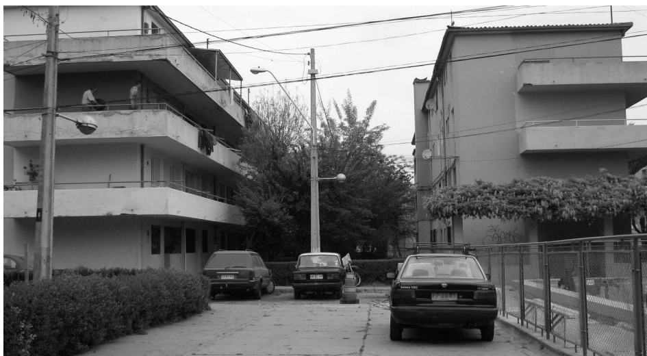
Figura 3: Población Huemul II 2008