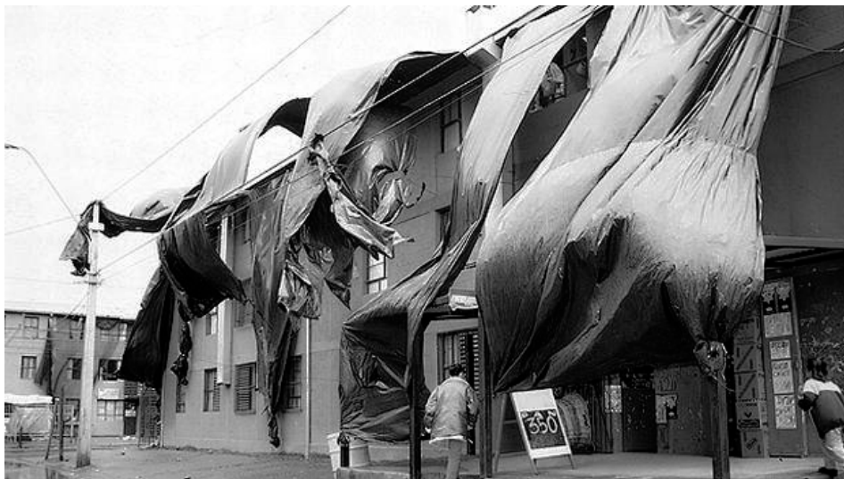
Figura 10: Casas Copeva