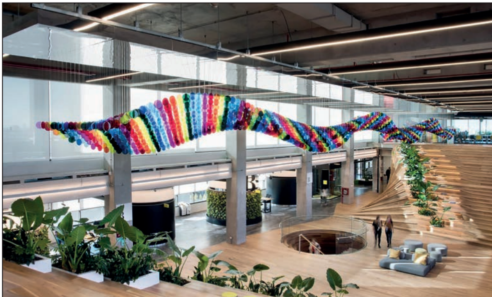
Imagen 1. Recibidor central de las nuevas oficinas de Mercado Libre en Buenos Aires

No hay rincón que no invite a la contemplación. Si se mira hacia arriba, se percibe una enorme estructura con pequeños círculos de colores que cuelgan desde gran altura, como puede apreciarse en la imagen 1.