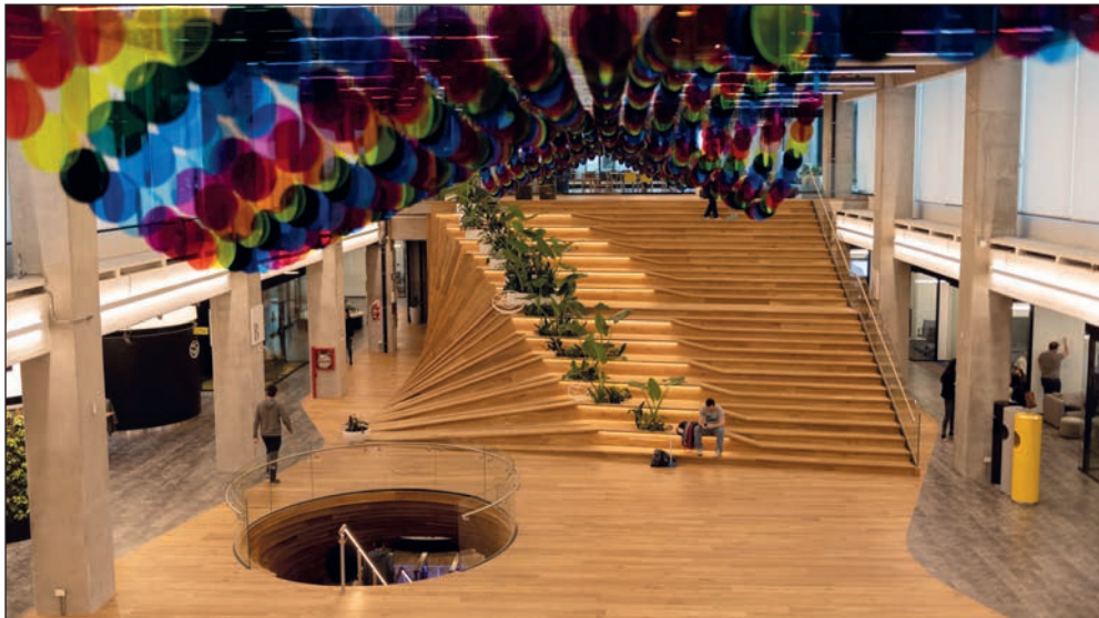
Imagen 2. Vista desde el primer piso de nuevas oficinas de Mercado Libre

Estas nuevas oficinas expresan de la mejor manera la visión del mundo que Marcos Galperin quiere transmitir a través de su empresa Mercado Libre. Se imponen como protagonistas de esta estructura espacial los “links o puntos de interconexión”, una gran escalera de madera en sintonía con una especie de hueco que conecta todos