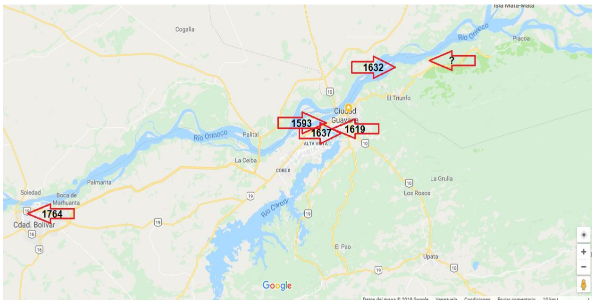
Mapa 1. Elaboración del Autor. 2019. Plataforma Google Maps. Datos de Américo Fernández (1995): Historia y Crónicas de los Pueblos del Estado Bolívar . Ediciones Publimeco. Barquisimeto Venezuela.