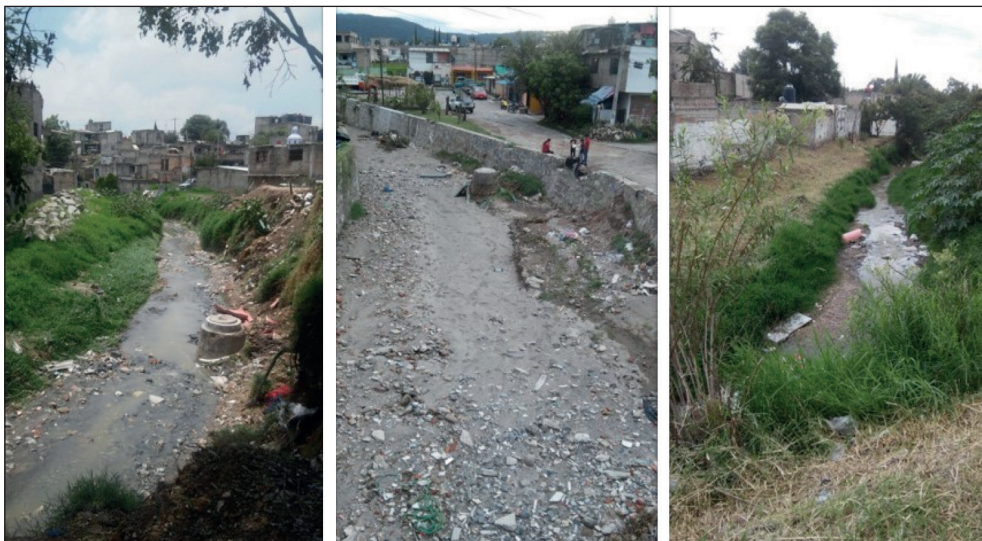
Fotografía 1. Viviendas cercanas a un arroyo en la colonia Miramar, en la zona de El Colli

En el caso de El Colli, se ha documentado un poco más el riesgo de inundaciones. Se sabe que, entre 2012 y 2016, el número de viviendas afectadas en colonias de la zona fue 316, aproximadamente (Gran y Ramos 2019). Además, los testimonios de la población afectada en El Colli recogidos por Gran y Ramos recalcan que varias personas (sin referir número exacto) han perdido la vida durante inundaciones, al ser arrastradas por la corriente que el agua crea en la cercanía de los antiguos arroyos. También comparten que cada año hay vecinos que pierden buena parte de sus bienes debido al ingreso del agua a sus viviendas. En ambos casos, El Colli y Las Mesas, el riesgo está relacionado con la ubicación de asentamientos humanos en espacios que anteriormente eran los cauces naturales de arroyos (fotografía 1) y con el estado de marginación en lugares donde se carece de servicios básicos y de la infraestructura para mitigar o prevenir las afectaciones.