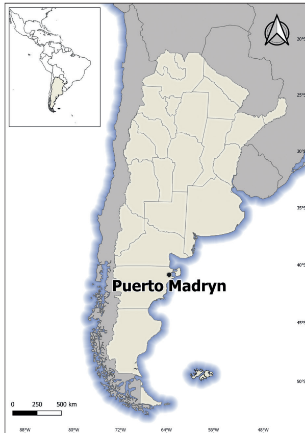
Figura 1. Localización de la ciudad de Puerto Madryn, Patagonia argentina

El acceso a ciertos bienes y servicios urbanos se constituye en un problema cotidiano para muchas familias, y “su ausencia y lucha por obtenerlos o suplirlos forman