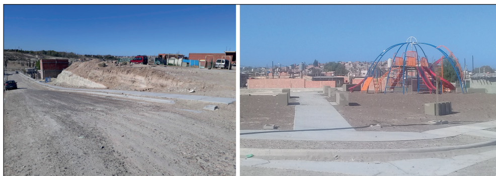
Figura 4. Promeba: Cordones cuneta. Figura 5. Promeba: Parque de juegos

Registro personal, 10 de septiembre de 2019.