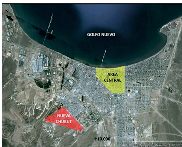
Elaboración propia sobre imagen de Google Earth.

El Barrio Nueva Chubut es producto de estos procesos de exclusión y segregación sociourbana. Iniciado a partir de toma de tierras en el año 2003, se fue configurando a partir de un conjunto de asentamientos autodenominados por sus habitantes (ver figura 3), quienes fueron generando diversas transformaciones en relación con la producción material del espacio, y persistiendo desde diversas prácticas en la lucha por ese espacio producido (Ferrari 2020).