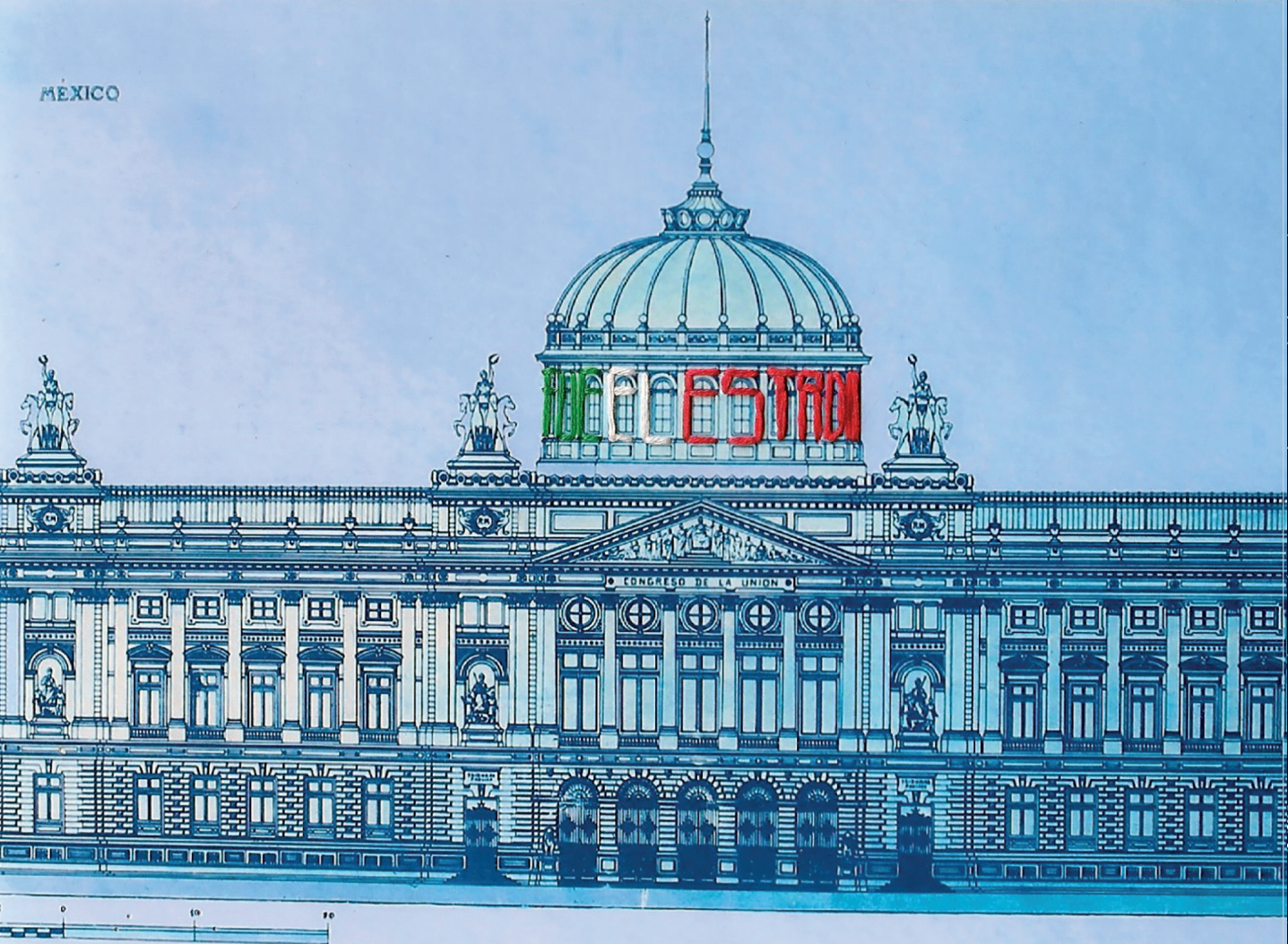
FACHADA PRINCIPAL (ORIENTE)