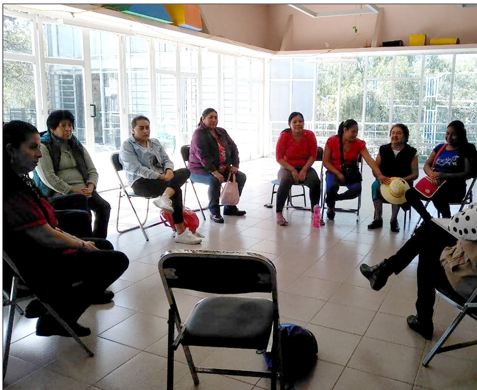
Figura 2. Mujeres en Movimiento reunidas en Casa de las Mujeres “Ifigenia Martínez”