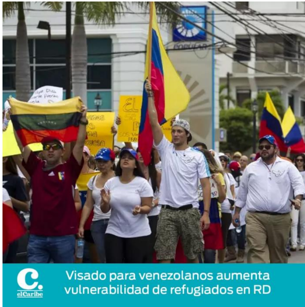
Imagen 3. 2 Aumento requisitos visado