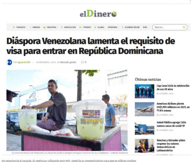
Imagen 3.1 Información sobre requisito visado