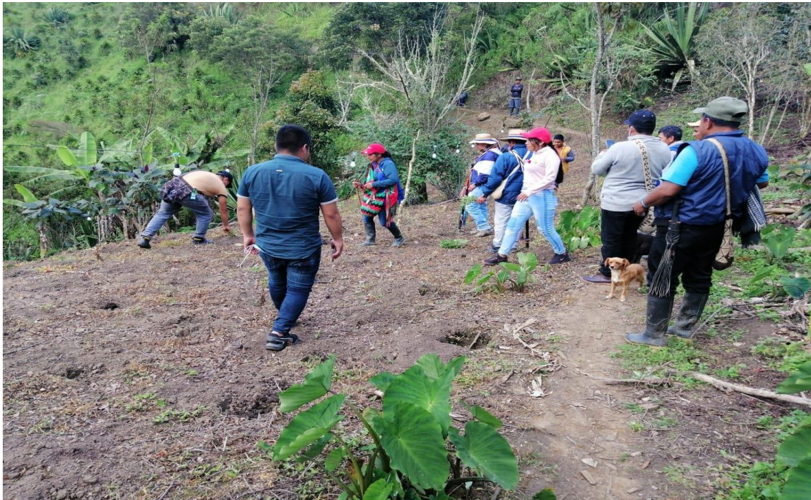
Foto 3.1. Minga de limpieza, Jambaló