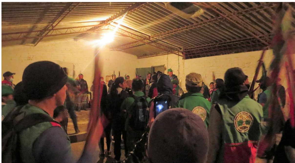
Foto 2.1. Ceremonia de iniciación de un recorrido territorial

El entusiasmo, alegría y vitalidad de los jóvenes de estas comunidades es avasalladora; es un sello característico. Esta energía les ha permitido reconocer y caminar el territorio con particular goce. Usualmente, los jóvenes entre 12-23 años suelen ser los primeros en llegar al punto de encuentro de los recorridos. Estos espacios tienen una percepción positiva en los jóvenes quienes disfrutan del caminar y compartir con otros miembros de la comunidad. Todos los que han participado llegan equipados para las duras jornadas. Entre los requisitos esenciales se encuentran las carpas, colchoneta, botas plásticas, un plato y cuchara (kit mingüero). Sin importar las lluvias, el arduo sol o incluso la presencia de actores armados, el recorrido debe realizarse. Antes de partir se debe abrir camino, prepararse espiritualmente (véase foto 2.1). Con todo esto cubierto, es hora de caminar (notas de campo de la investigadora).