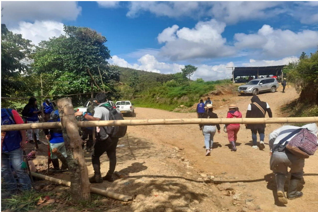
Foto 2.2. Punto de control, Delicias