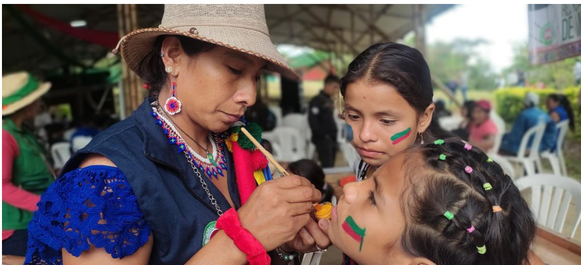
Foto 3.3. VII minga regional de semillas de identidad, autoridad y defensa territorial, Caloto