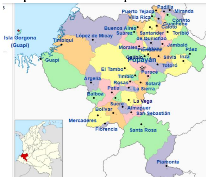
Mapa 2.1. Ubicación del departamento del Cauca

En el suroccidente colombiano se encuentra anclado el departamento del Cauca (cf. Mapa 2.1.). Entre el océano Pacífico, la cordillera occidental y central se forman paisajes caprichosos que han albergado las crudas expresiones del conflicto armado, así como las acciones que albergan la esperanza de la población que habita este lugar. Este territorio ha sido escenario de las luchas por el derecho a la tierra de los diferentes grupos indígenas que se mantuvieron en resistencia desde tiempos remotos. Sin embargo, la ola imparable del conflicto armado que intentó penetrar cada rincón del departamento trajo nuevos oponentes, entre estos los actores del narcotráfico.