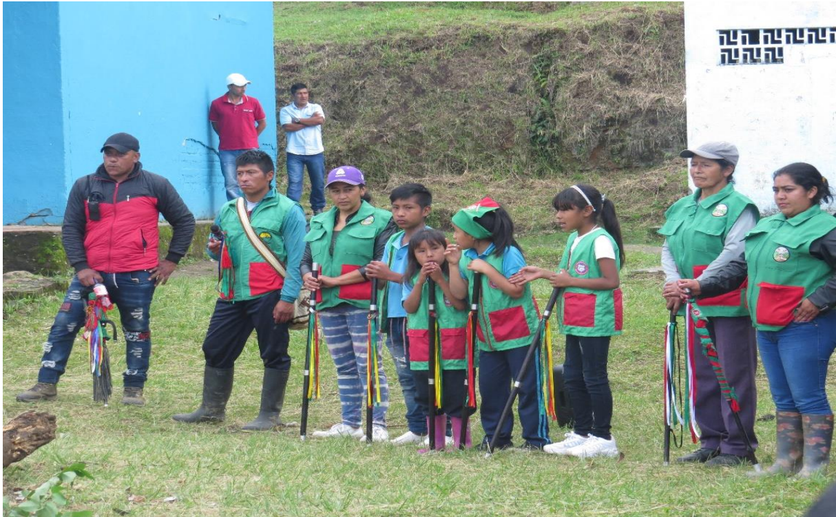
Foto 2.3. Encuentro territorial de guardia indígena, Coconuco