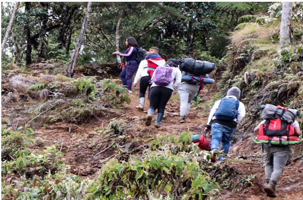
Foto 3.4. Recorrido territorial, Chimborazo