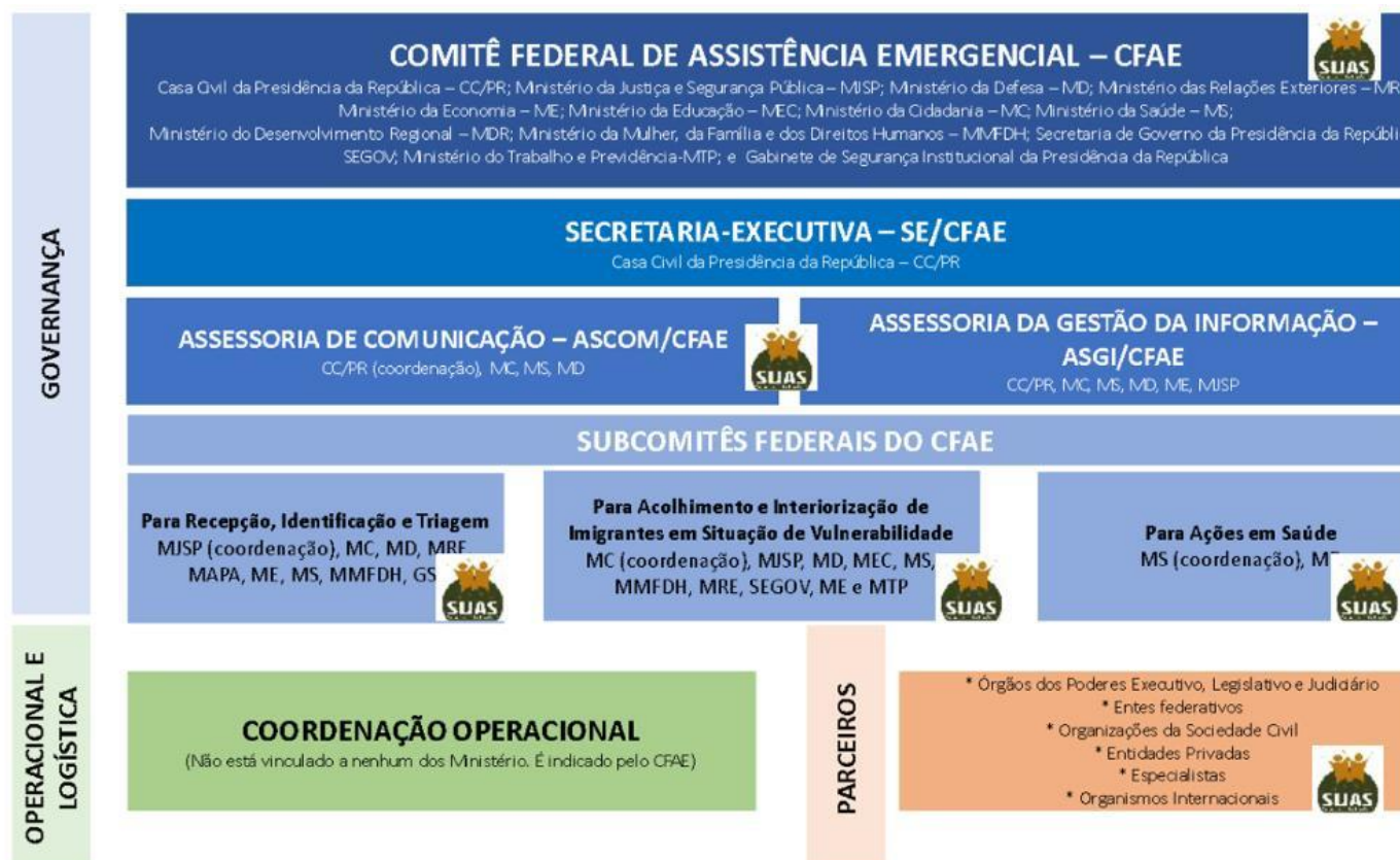
Cuadro sobre la composición de la coordinación y operación de la Operación Acogida