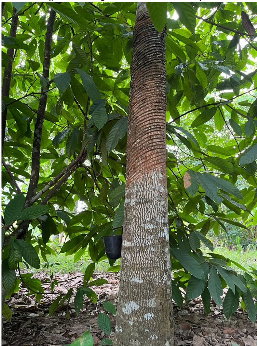
Figura 8- Seringueira com desbastes adequado