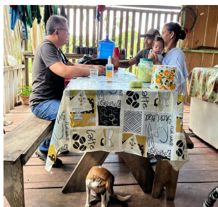
Figura 10- Realização de entrevista na família Cateringer

Já na propriedade da família Cateringer (Figura 10) o incremento com o Programa Floresta Plantada possibilitou a remuneração do filho adolescente, de 17 anos, que para ajudar nas atividades da propriedade recebe agora um salário no valor de R$1500, o que equivale a cerca de um salário e meio em 2022.