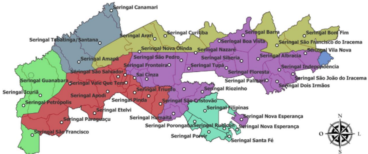
Figura 2- Seringais da RESEX Chico Mendes

A comunidade estudada é a Ramal da Torre, a qual está situada entre (especificamente, na divisa) do Seringal Porvir e do Seringal Santa Fé (Figura 2).