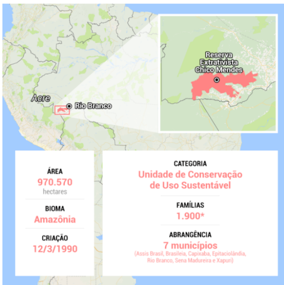
Figura 4- RESEX Chico Mendes- Aspectos Gerais.

A Reserva Extrativista Chico Mendes (Resex Chico Mendes) possui uma área de 9700 km 2 . Tal Unidade de Conservação é a segunda maior unidade de proteção da categoria, abrange 07 municípios, sendo estes: Assis Brasil, Brasileia, Xapuri, Capixaba, Eptaciolândia, Sena Madureira e a capital do estado do Acre, Rio Branco. A RESEX Chico Mendes, possuía em 2009, uma população de 10.327 pessoas, distribuídas em 1.900 famílias (PONTES, 2018).