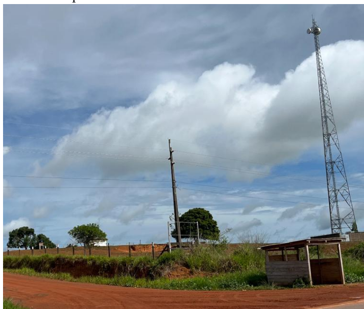
Figura 3- Torre de telefonia que deu nome à comunidade

Neste subcapítulo, buscou-se apresentar aos leitores a comunidade de Ramal da Torre (Figura 3), como têm-se poucos trabalhos sobre a região específica, aqui, foi reportado trechos e informações obtidas nas entrevistas, cujas abordagens utilizadas são melhor explicadas no capítulo metodológico deste trabalho.