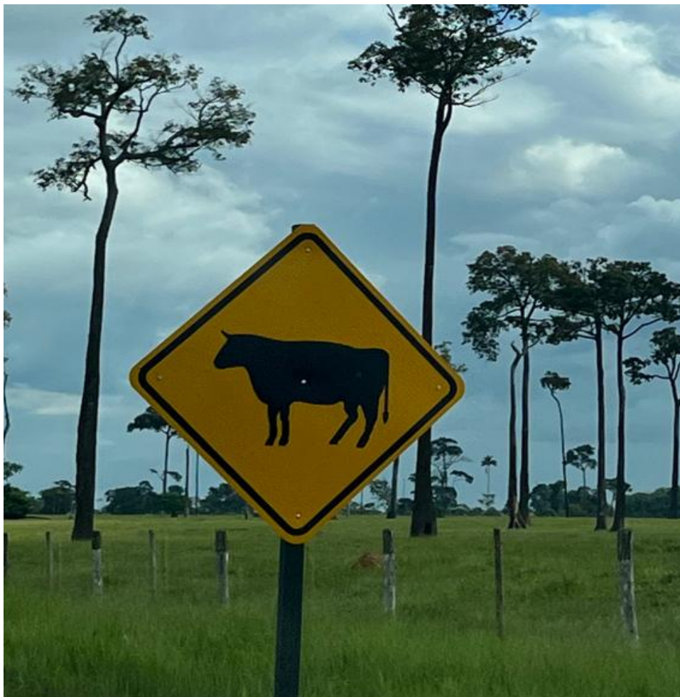
Figura 6- BR 317 o boi à frente das castanheiras a pecuária em detrimento da floresta.