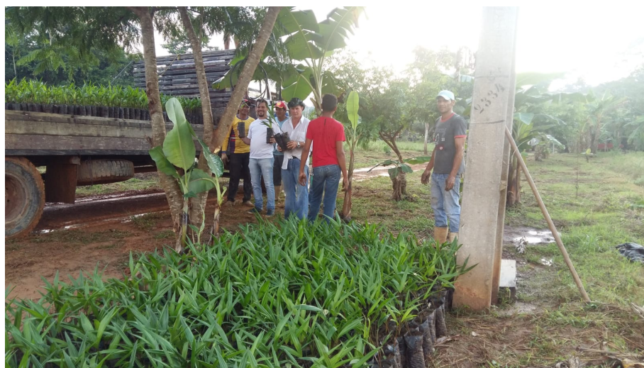
Figura 7- Escritório da SEAPROF realizando entrega de mudas do PFP.

A inserção das comunidades no Programa se dava através de consultas junto à comunidade local realizadas pelos escritórios da SEAPROF nos municípios do interior em visita aos assentamentos rurais. As comunidades selecionadas passavam pelo processo de preparação da área e recebiam a doação das espécies que eram entregues pelo Estado na sede do município. Já os produtores ficavam responsáveis pelo plantio e o cultivo (Figura 7).