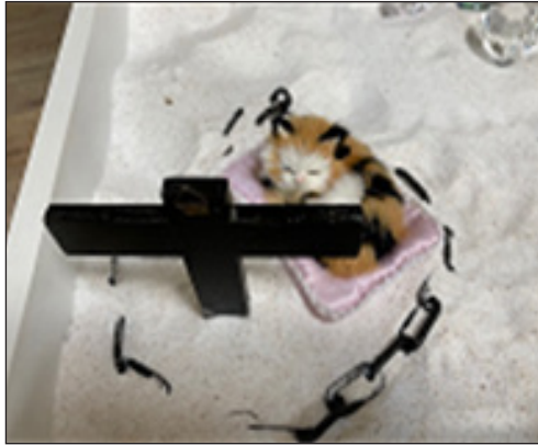
Figura 5. La cruz