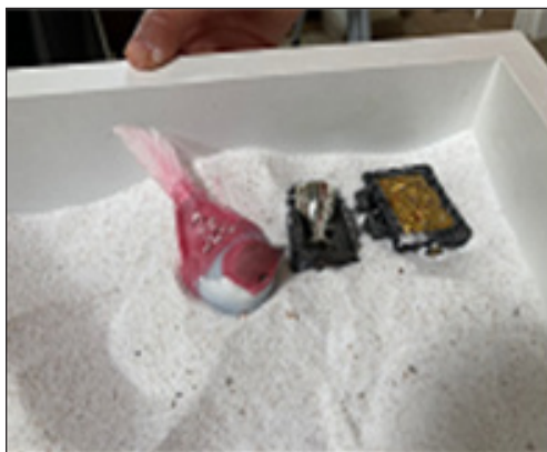
Figura 4. Juego de arena