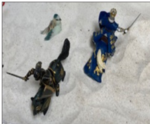
Figura 6. Caballeros