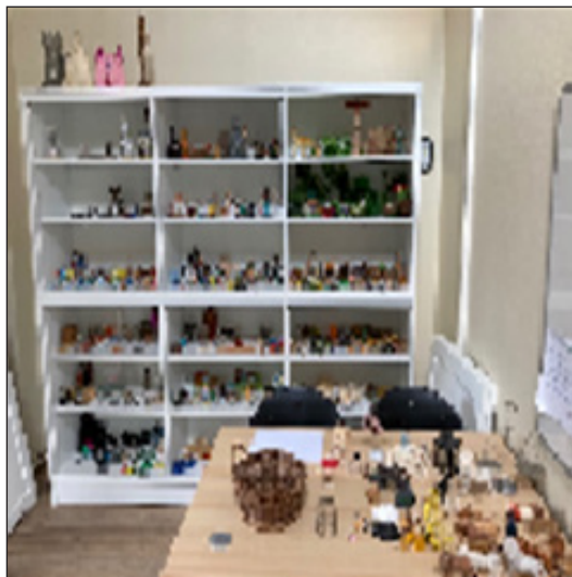
Figura 2. Juego de arena