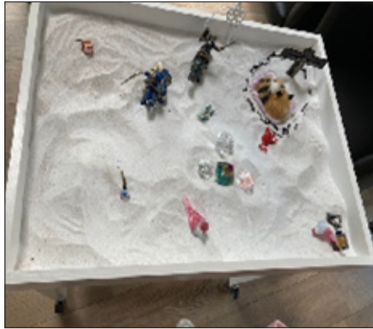
Figura 3. Juego de arena

Fuente: Hospital Psiquiátrico para Niños y Adolescentes La Petite Maison