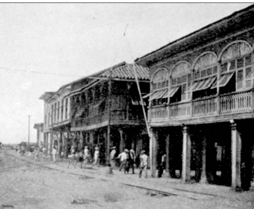
Guayaquil, calle Villamil, hacia 1920

para cumplir con la utopía en ciernes: primero, el Guggenheim como institución museal, forma parte esencial de la escena y los circuitos internacionales del arte en voga y, segundo, Bilbao está en el primer mundo, donde ese arte contemporáneo ha sido abrazado entusiastamente desde hace décadas. De ahí la preocupación, declarada en la folletería oficial, por “insertar al museo en los circuitos de arte contemporáneo a nivel global” y, segundo, por generar una infraestructura tendiente a educar y familiarizar al medio guayaquileño con el lenguaje de la contemporaneidad en las artes, principalmente visuales. Por ello la importancia brindada al -así llamado- “Programa de Inserción del Arte en la Esfera Pública” durante los primeros años.