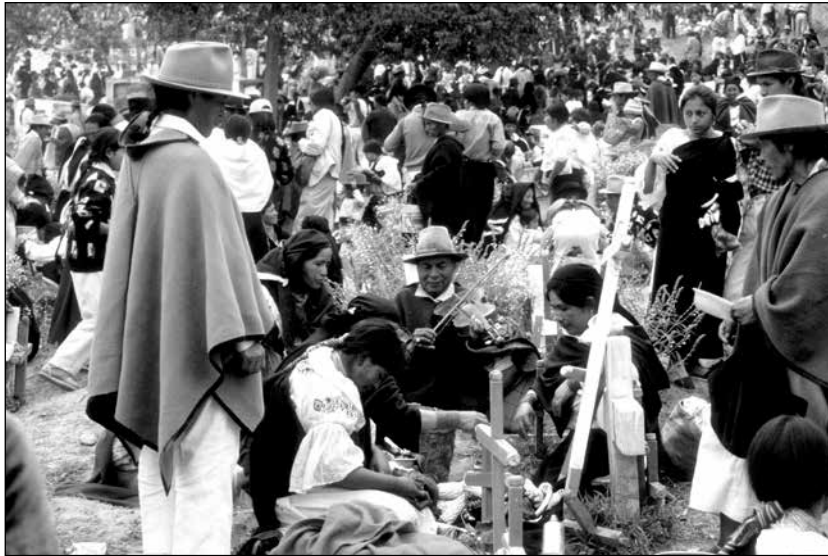
Familias otavaleñas alimentando a los muertos en el cementerio, noviembre 1990.