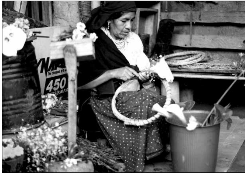
Otavaleña haciendo una corona funeraria en Peguche, 1993.