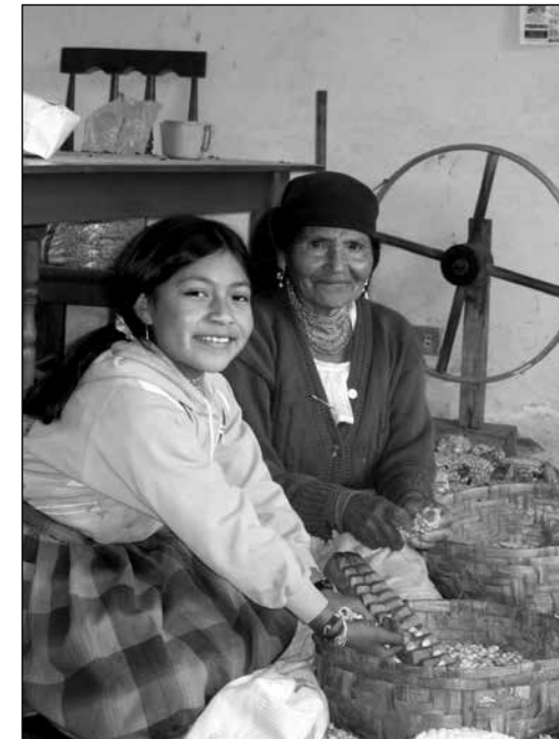
Otavaleñas pelando maíz en Peguche, 1990.

Desde la época prehispánica, los agricultores andinos han usado sus conocimientos eco-agrícolas para cultivar una gran variedad de plantas adaptadas a microecosistemas específicos. Durante siglos, los agricultores han accedido deliberadamente a microzonas diferentes con el fin de producir e intercambiar productos que proporcionan una dieta variada y nutritiva (Murra, 1972; Brush, 1977).