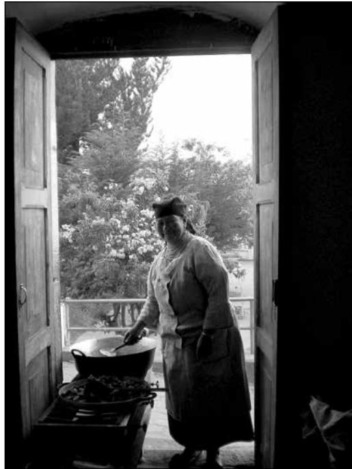
Una mujer otavaleña que contribuye a los ingresos de la familia ofreciendo delicadezas preparadas en su casa.