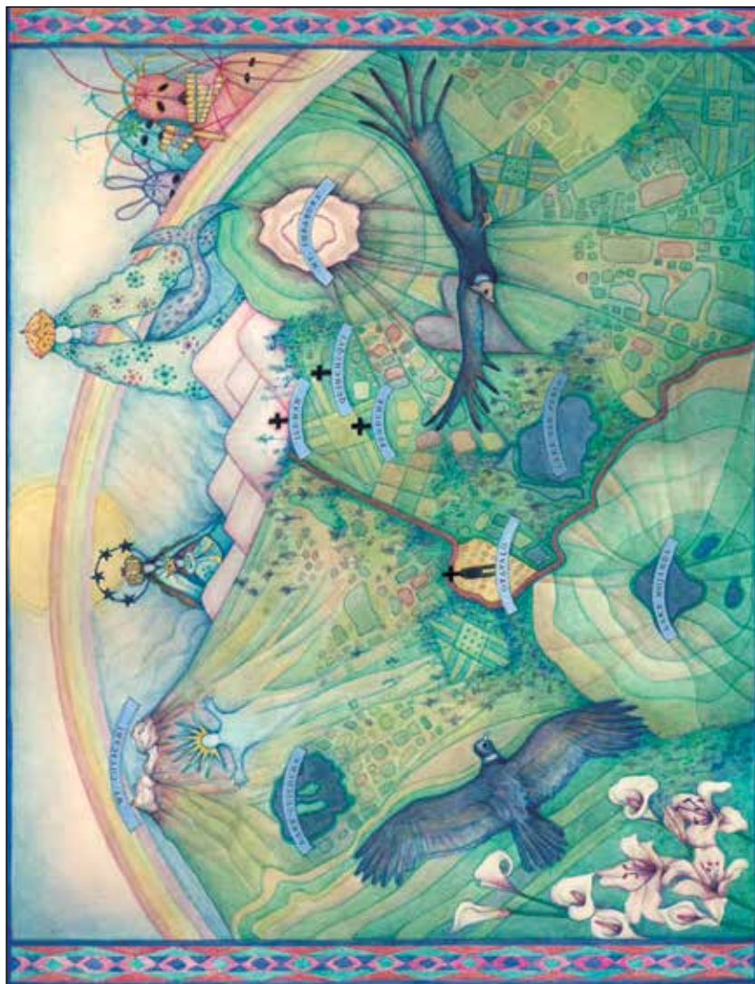
Valle de Otavalo. Dibujado por Peonia Vázquez-D'Amico.