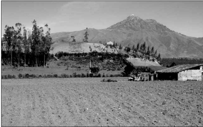
Campo recién arado y casa en Peguche a 2 835 m con el Cotacachi de 4 939 m de altitud.