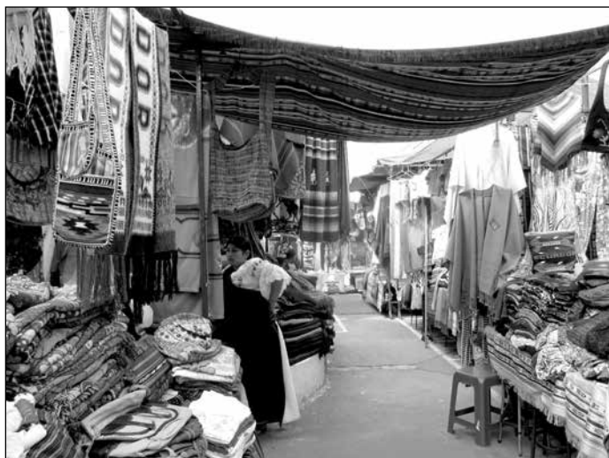
Otavaleña en su quiosco, Plaza de los Ponchos, Otavalo.

su creatividad y visión para los negocios en cuanto al diseño y venta de tejidos, al igual que por sus ricas tradiciones musicales (Parsons, 1945; Buitrón, 1947 y 1951; Buitrón y Collier, 1949; Villavicencio, 1973; Salomon, 1981; Chávez, 1982; Kyle, 2000; Meisch, 2002; Colloredo-Mansfeld, 1999; Wibbelsman, 2005). Las artesanías incluyen (pero no se limitan a) el diseño y fabricación de cinturones, tapices, chales y ponchos tejidos a mano; instrumentos musicales andinos; suéteres, mochilas, bolsas y hamacas tejidos a mano y a máquina. Los nativos de Peguche siguen vendiendo sus productos desde sus talleres o en el mercado de artesanías de la ciudad de Otavalo, lugar aclamado por propios y extraños como el más grande centro comercial indígena en América del Sur; algunos viven de forma multilocal dentro de lo que el sociólogo David Kyle llama el “comercio de la diáspora” (2000), viajando por el mundo como comerciantes, músicos y trabajadores; mientras que otros subsisten con salarios devengados como jornaleros itinerantes o agricultores. Muchos de los tres mil habitantes de la parroquia, el 98% de los cuales son indígenas, han aprovechado y desarrollado oportunidades de negocios, educativas, artísticas y políticas, y las coordinan dentro y a través de redes globales.