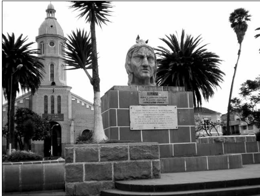
Estatua de Rumiñahui en el centro del Parque Bolívar, Otavalo.