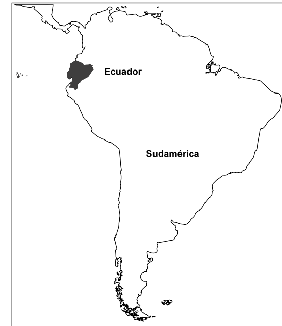
Mapa de Sudamérica.

nacionalidad de los pueblos indígenas, se concentran en los Andes, y son también uno de los mayores grupos en la región amazónica 11 .