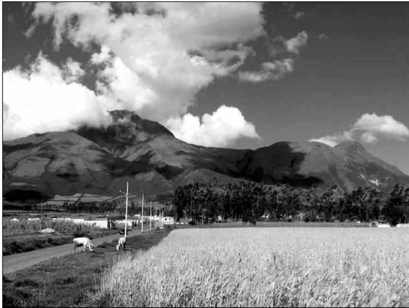
Volcán Imbabura flanqueado por campos de cebada en Peguche.

Peguche muestra muchos de los accesorios de una sociedad de consumo, incluyendo autobuses, camiones, vehículos deportivos utilitarios, televisores, DVD, computadoras, ropa de moda, hoteles y edificios de concreto de dos y tres pisos que alojan tiendas, talleres, y hogares. Sin embargo, lejos de que todos los pegucheños compartan altos niveles de vida, muchos de ellos trabajan largas horas en el taller o en el terreno de algún otro.