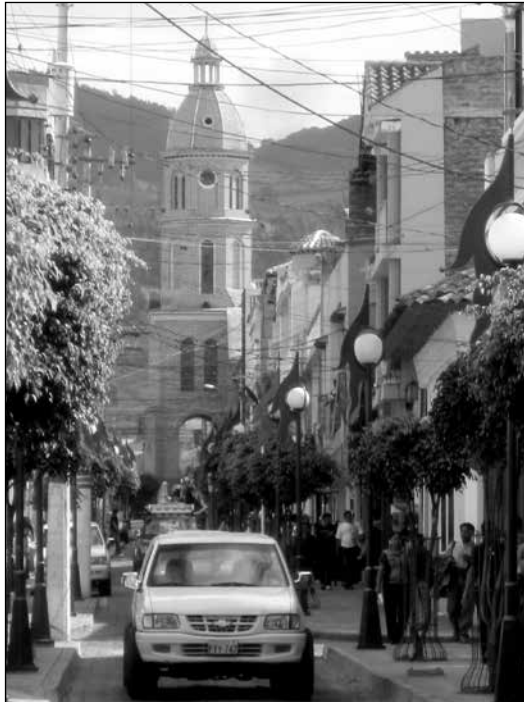
Calle Sucre en Otavalo conecta el Parque Bolívar con la Plaza de Ponchos.

feria es una oportunidad para interactuar en el escenario con auténticos vendedores indígenas en busca de artesanías extraordinarias, kitsch, o buenas ofertas.