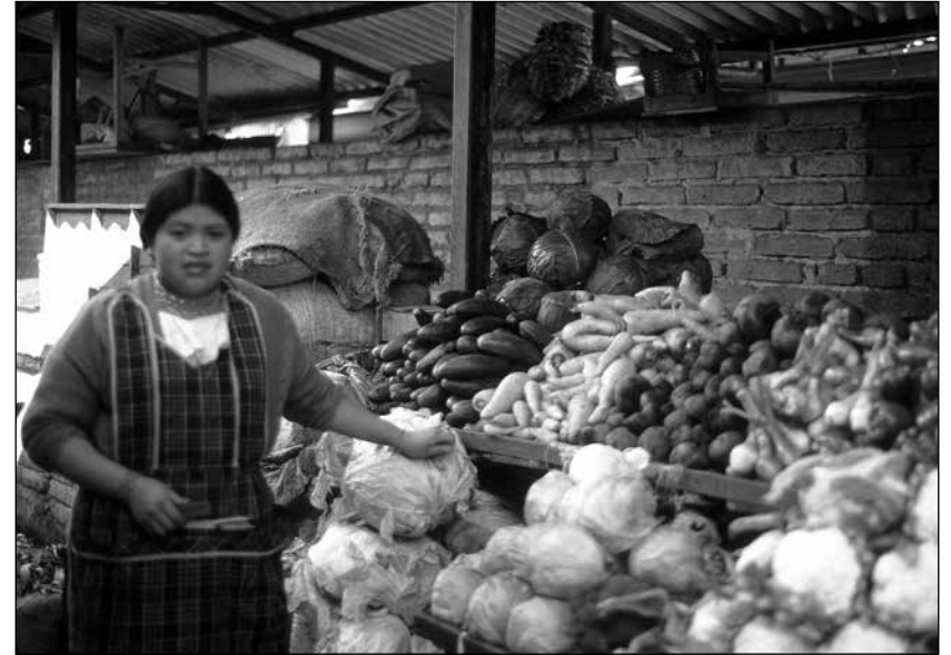
Una adolescente otavaleña vendiendo productos en el negocio familiar en el mercado 24 de Mayo antes de emigrar a Bélgica en 1993.

a, y se condimentan con, capas de historia y cosmología. Las costumbres alimenticias son viscerales y contribuyen a los parámetros fluidos de una comunidad cultural.