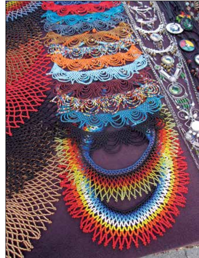
Joyería hecha a mano realizada por saraguro kichwas y expuesta en la Plaza de Ponchos, abril 2010.