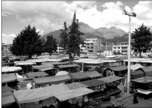
Vista de la Plaza de Ponchos. A la distancia el volcán Imbabura.