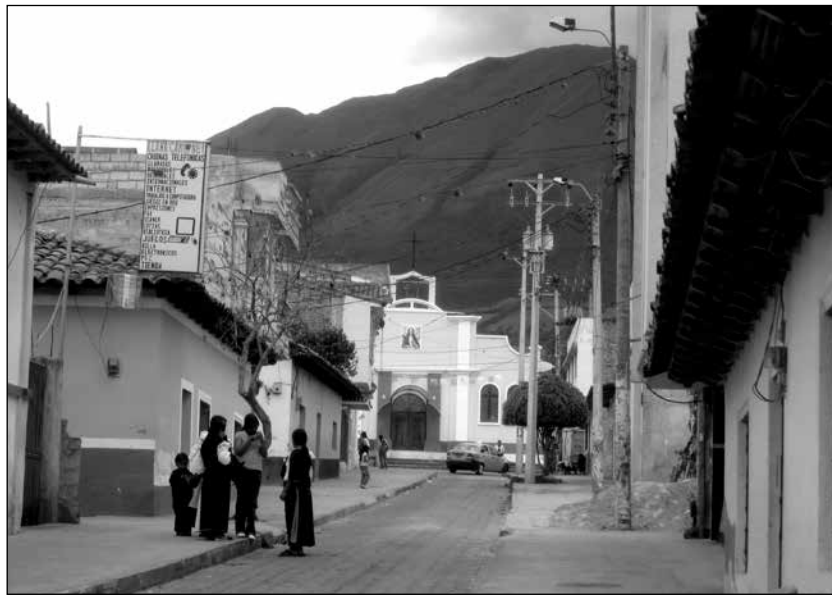
La calle principal en Peguche.