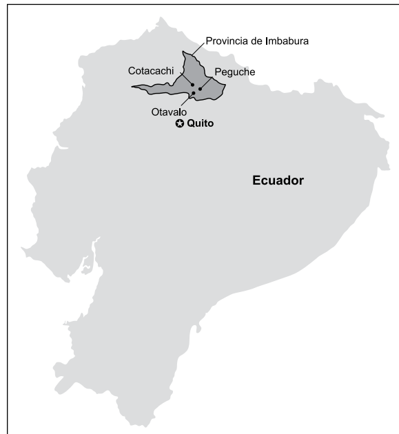
Mapa de Imbabura.

Históricamente, en Ecuador ha existido una jerarquía socioeconómica, sin embargo, siempre ha sido posible cuestionar y cambiar esa estructura (tema sobre el cual incluiré historias más adelante). Dentro de este marco jerárquico, las élites afirman ser descendientes de los conquistadores y colonizadores europeos. Se los conoce como “blancos” o “blanco-mestizos”. Los mestizos de ascendencia europea e indígena son personas dentro de un grupo diverso que abarca desde la nueva generación (aquellos que están forjando un nuevo camino acorde con el siglo XXI) hasta los que, de acuerdo a Lynn Stephen, “aspiran a la ‘blancura’ para así escapar del estigma que acompaña a todo aquello asociado con lo indígena, con la esperanza de obtener empleo en algún área donde los indígenas han sido usualmente excluidos” (1991: 320). Por último, al final de este legado de inequidades establecidas durante la época colonial están las nacionalidades indígenas y los afroecuatorianos (Wibelsman, 2003; Crespi, 1975; Stephen, 1991; Whitten, 1981).