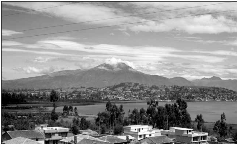
Entrada a Otavalo, Valle del Amanecer, vía lago San Pablo con el Cotacachi enmarcando el cielo.

en la Sierra con ‘caballos, tierra sembradas y huasipungueros ’ ” (North, 2000: 1). La reforma agraria liberó a los huasipungueros de “condiciones laborales semifeudales –lo cual permitió que se les otorgaran aquellos derechos civiles anteriormente negados– y delineó mecanismos para que pudiesen tener acceso a tierras. Los programas sociales en educación, salud, seguridad social e infraestructura también acompañaron a la reforma agraria” (Yashar, 2005: 92). El período de gobierno militar en Ecuador, de 1972 a 1979, consolidó el poder político al ejercer control sobre los recursos petroleros y construyó una agenda nacionalista con reformas. Al mismo tiempo, los programas de industrialización de sustitución de importaciones (ISI), recomendados por la Comisión Económica de las Naciones Unidas para América Latina, aumentaron los indicadores de calidad de vida en este período de relativa prosperidad 17 .