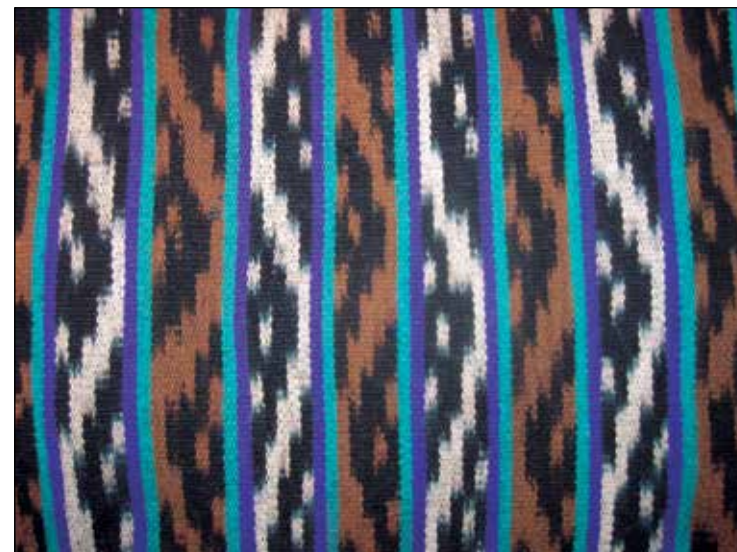
Chal Ikat de Gualaceo, Azuay. Vendido en la Plaza de Ponchos, diciembre 1989.