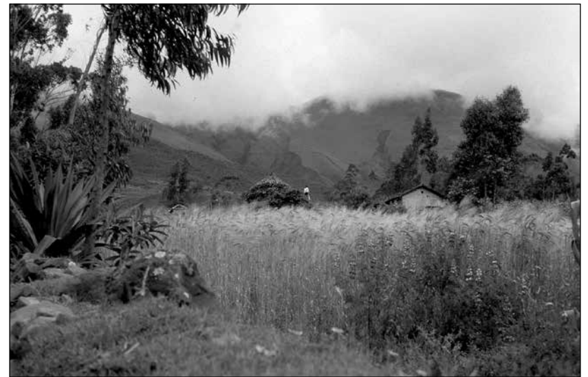
Casa de Peguche rodeada de campos con una parva en el centro.