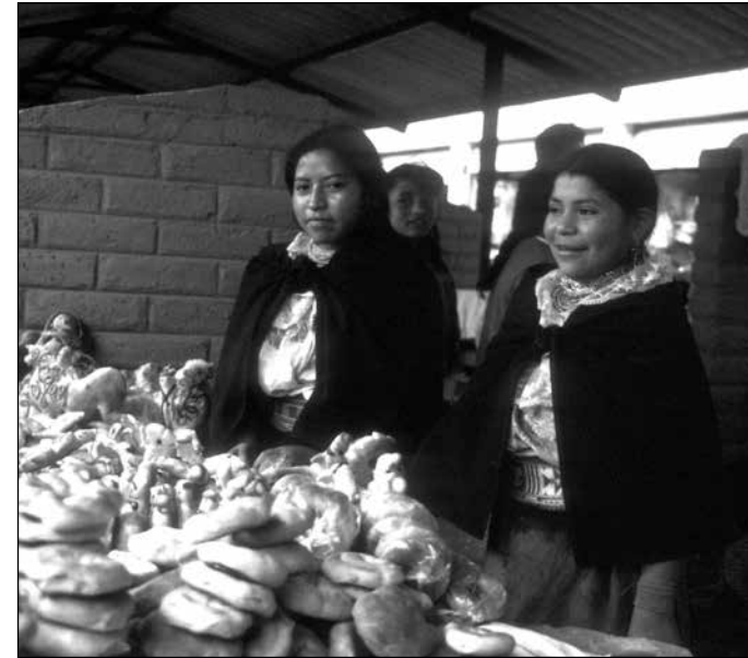
Otavaleñas vendiendo guaguas de pan en el mercado 24 de Mayo en Otavalo, 1990.