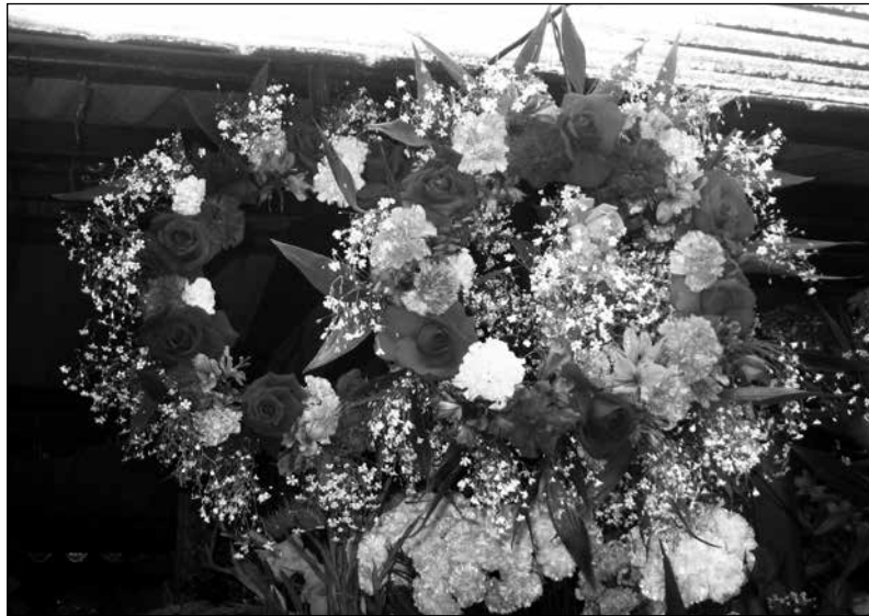
Con el crecimiento de la industria de flores de exportación a finales de 1990, las coronas funerarias se convierten en artículos comerciales en el mercado 24 de Mayo, 2009.