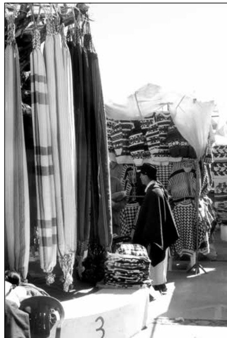
Otavaleño en un quiosco en la Plaza de Ponchos.