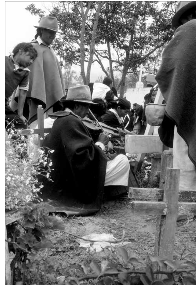
Otavaleño tocando música a los seres queridos que han partido, noviembre 1990.

Dentro del ciclo agrícola, el Día de los Difuntos coincide con el inicio de la siembra del maíz. Este día sugiere el renacimiento y regeneración de las fuerzas alimentarias, proceso que se logra a través de alimentar y despertar a los antepasados que viven en el interior de la tierra. En este caso, las obligaciones rituales realizadas entre los vivos-presentes y los muertos-pasados demuestran relaciones recíprocas que tienen consecuencias para el futuro con respecto al sustento físico, social y espiritual. El hecho de que los ancestros andinos descansan en la tierra junto con las deidades de las montañas recuerda a la gente que el entorno es el depositario de espíritus que interactúan e influyen sobre los vivos, no solo a través de acciones concretas como la agricultura, sino también a través de sueños y plegarias. A partir de estas raíces enredadas en la tierra y la memoria podemos observar el crecimiento de nuevos cultivos y, en última instancia, de nuevas generaciones. A través de este ritual de cooperación y ayuda mutua se renueva un sentido de comunidad entre los vivos, los antepasados y diversos espíritus. Se necesita un conocimiento integral para que cada generación pueda producir cose-