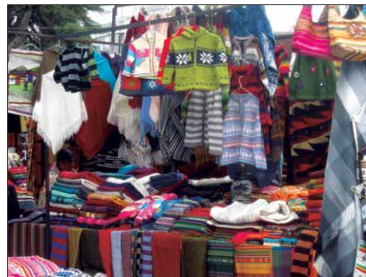
Quiosco de textiles variados, Plaza de Ponchos, marzo 2011.