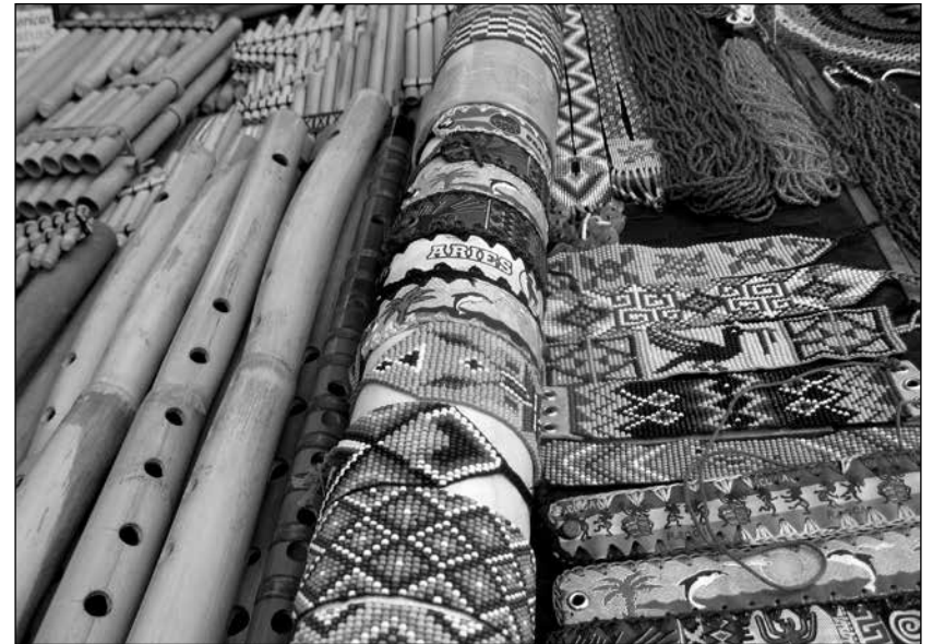
Abalorios e instrumentos andinos en exposición para la venta en la Plaza de Ponchos.

tividades de Marta y Ana en los campos, jardines, talleres y transacciones comerciales ayudan a proporcionar la infraestructura que, directa o tangencialmente, pone a funcionar el complejo conjunto de los mercados locales y globales. Esas actividades las conectaban conmigo y con otros y apuntaban al escenario vivo que mantiene en pie a la feria. Las mujeres son coproductoras auténticas de la imagen cultural y los productos, y este poder de permanencia resulta muy atractivo para las personas ajenas a la comunidad. Ellas también son agentes activos que están transformando sus vidas en narrativas de su propia creación, ya sea localmente o en el extranjero.