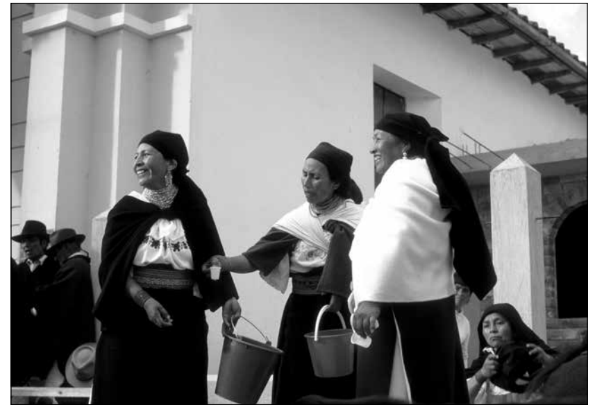
Otavaleñas sirviendo chicha en la celebración de San Pedro en Peguche, 1990.