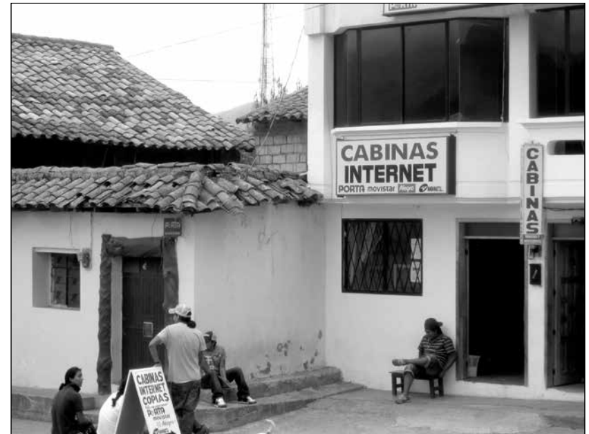
La plaza principal de Peguche con servicios de teléfono e internet, 2010.