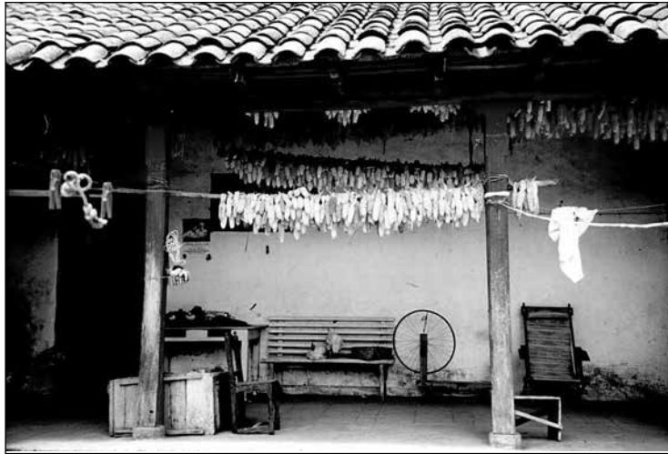
Corredor de la casa de Rosa Lema.