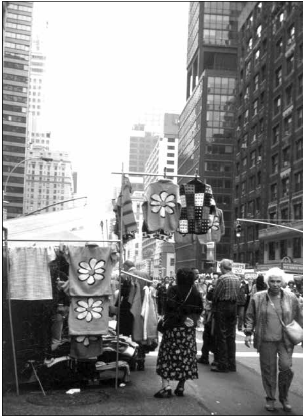
Otavaleños ofreciendo a la venta suéteres hechos a mano en una feria de la calle en Nueva York, otoño 1990.

había viajado al extranjero aunque fuera una vez. Para el año 2000, con la profundización de la crisis económica, ese porcentaje seguramente aumentó de manera considerable. De hecho, hoy en día es difícil encontrar una familia que no haya sido afectada por la migración de una forma u otra 23 .