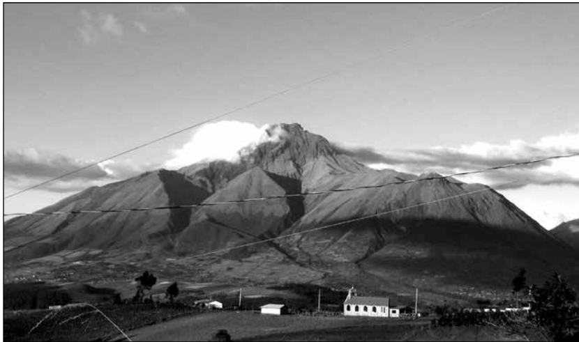
El volcán Imbabura, repositorio ancestral de la historia de Otavalo.

lístico del conocimiento es la noción de un espíritu de reciprocidad que mantiene las diversas dimensiones de la realidad coherentes y en relativa armonía. Este tipo de metafísica presenta una visión del mundo que no considera las diferencias en términos duales. Por el contrario, este enfoque es incluyente y funciona como un ecosistema, donde las interacciones humanas con el medio ambiente y lo sobrenatural están a la par y enlazadas con las relaciones sociales. Nutrir esas interconexiones es esencial para el bienestar social y personal.