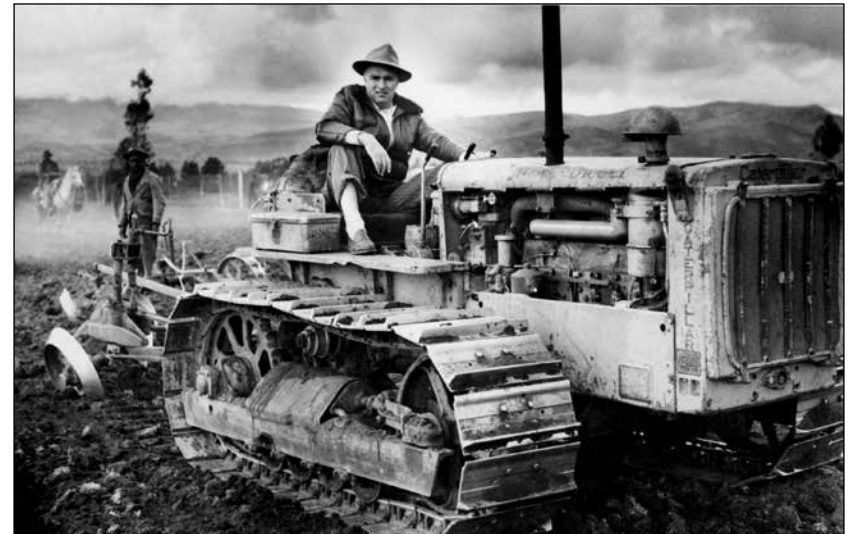
Galo Plaza Lasso intentó que Ecuador se abriera al desarrollo.

te un período de relativa estabilidad política y prosperidad 1 . Su gobierno aplicó un modelo occidental de desarrollo en las zonas rurales del Ecuador, con la intención de modernizar la agricultura como medio para acelerar la integración del país a la economía global. Esta política se centró en la agricultura industrializada y la producción de monocultivos para mejorar los rendimientos y las exportaciones. Sin embargo, al mismo tiempo, su gobierno perpetuó el statu quo a través de la gestión de políticas socialmente conservadoras que mantenían el poder, los privilegios y la tenencia de la tierra en manos de las élites.