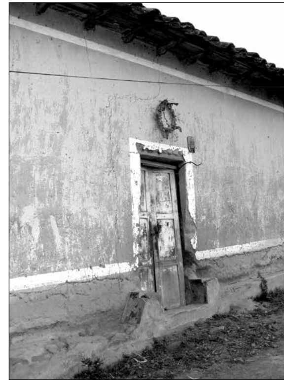
Corona de flores colgada sobre la puerta anunciando una muerte reciente en Peguche.

flores para sus mesas al día siguiente. Sus prioridades eran claras: aunque la venta de coronas no era un negocio tan lucrativo como el de las flores de los restaurantes, las obligaciones culturales primaban sobre la decoración de las mesas en las que cenaban los turistas 12 .