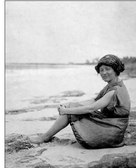
Elsie Clews Parsons al frente de su casa familiar de verano en Newport, Rhode Island, 1916.

Allí, fuera de los salones confinantes de la alta sociedad neoyorquina, interactuó con hombres y mujeres solteros, debatió sobre temas sociales e intelectuales, y se apartó de las normas sociales limitantes.