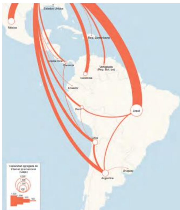
Mapa 2.1. Capacidad de las principales rutas internacionales de América Latina, 2013