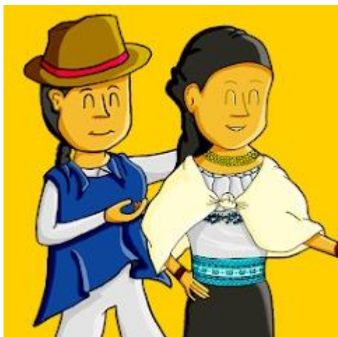
Figura 3.2. Aplicación Otavalo Rimay, 2022