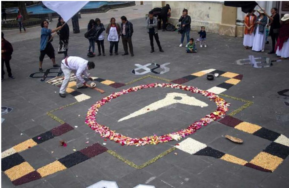
Foto 0.12 Pampamesa, “Recorrido Equinoccial” Parque San Sebastián, Cuenca 2018.

fue la experiencia, el proceso. “La procesión, bailar, el proceso equinoccial, el trabajo con el taita, descubrir la comunidad, para mí eso fue la obra y eso no se muestra (...) Es algo más íntimo, está dentro de este proceso artístico, pero que no necesariamente llega al circuito del arte; el proceso y la acción, más que artístico, era espiritual (Tue M 2021).