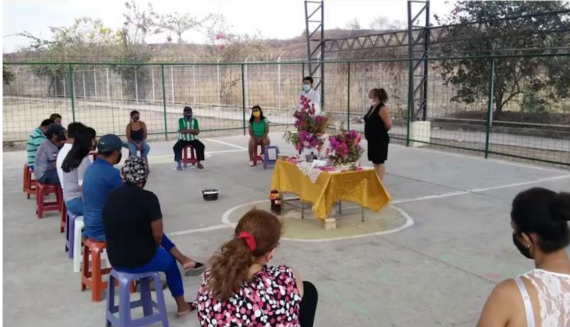
Foto 0.5 "Rituales de despedida", Barrio Socio vivienda 2. Guayaquil, 2020.