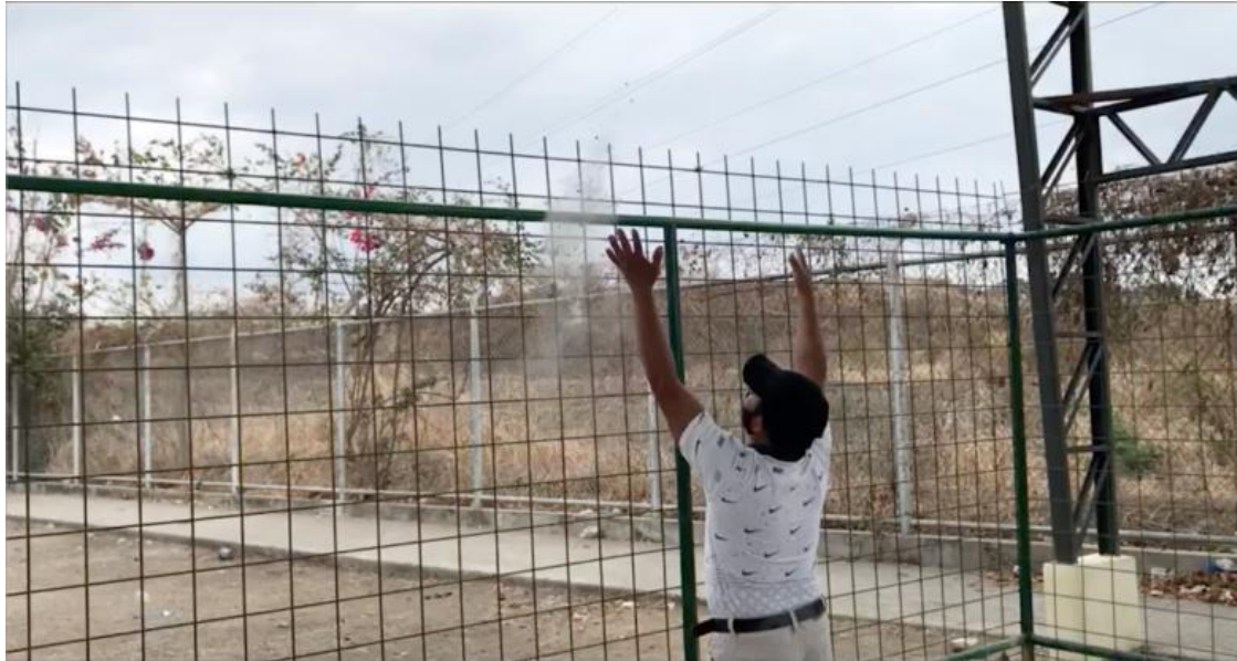
Foto 0.16 Ceremonia “Rituales de despedida”, Barrio Socio Vivienda 2, Guayaquil 2020.