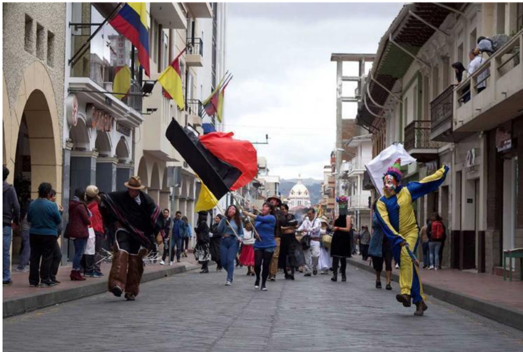
Foto 0.11 Procesión por la calle Simón Bolívar, “Recorrido Equinoccial”, Cuenca 2018.