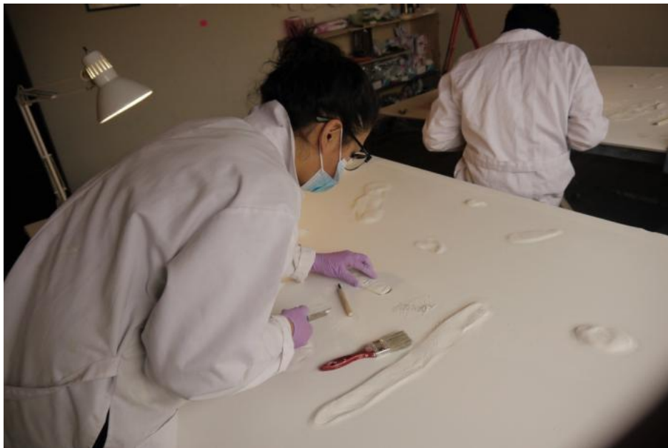
Foto 0.9 Ensamblaje de la obra “Geografías de la mortalidad”. Cuenca 2018.

En cuanto a los acuerdos de participación, Vidal menciona que fue explícita al momento de entablar la idea de la participación, es decir, la definición del rol que iba a cumplir el participante dentro del proyecto. “Tú me dejas sacar un molde de tu cicatriz que va a ser utilizada dentro de un espacio con más cicatrices de más gente, como con 150 personas, y a cambio yo te doy una reproducción de tu cicatriz” (Vidal 2021).