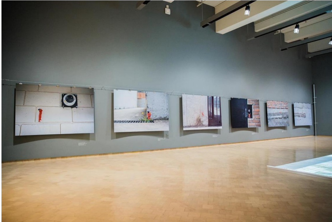
Foto 0.8 Obra "Circuito Cerrado", Museo del Barrio, New York 2019.