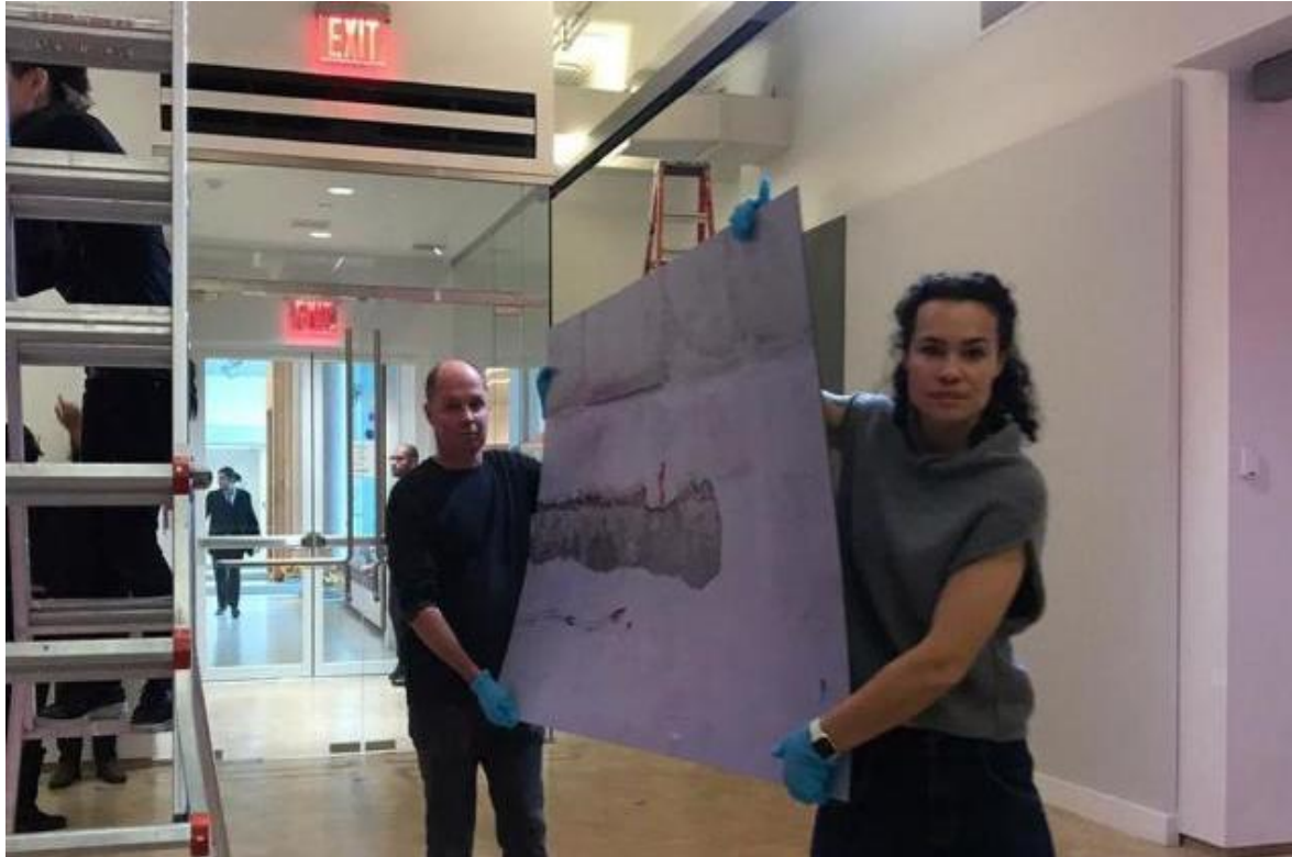
Foto 0.7 Montaje de la obra “Circuito Cerrado”, Museo del Barrio, New York 2019.