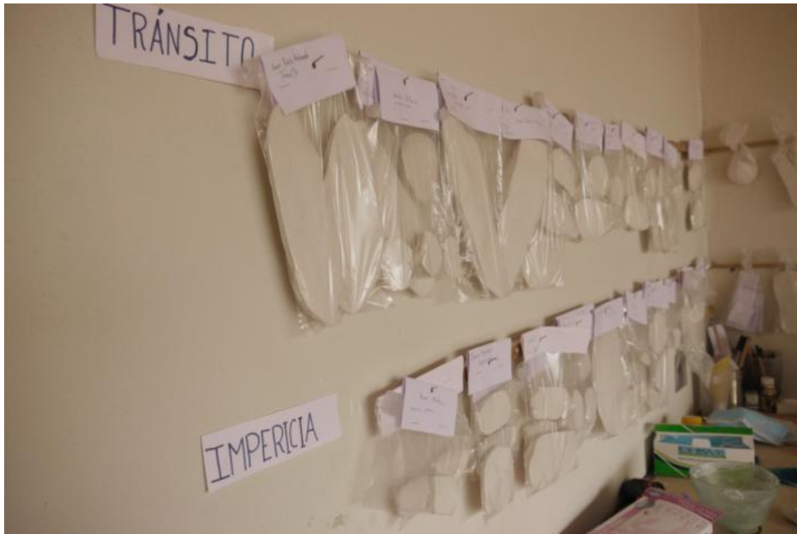
Foto 0.10 Archivo de cicatrices para “Geografías de la mortalidad” Cuenca 2018.

entonces era: ¿Cómo ubicar todo al mismo nivel? pensando que no hay más ni menos” (Vidal 2021).