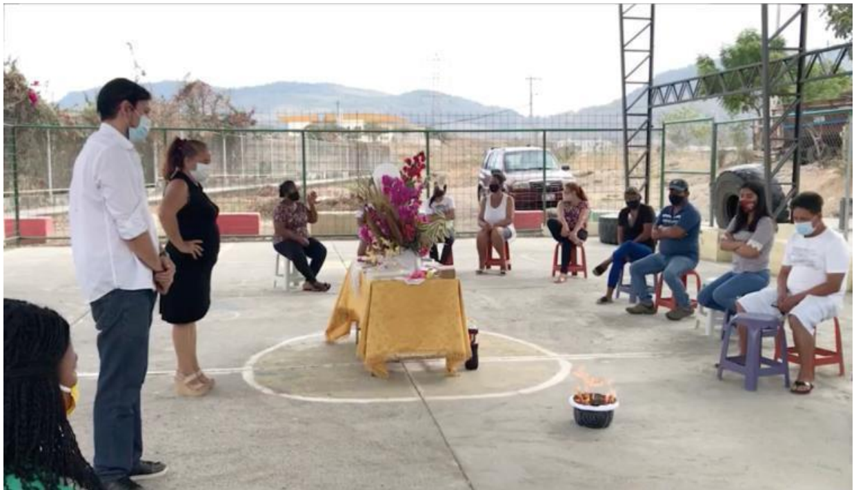
Foto 0.15 Ceremonia “Rituales de despedida”, Barrio Socio Vivienda 2, Guayaquil 2020.

En la entrevista que realizamos a Falco, el artista, a manera de relato, nos fue contando el proceso de la obra Rituales de despedida , empieza enfatizando que no sabe si llamarle o no obra de arte: “es un trabajo colectivo-colaborativo que hicimos con estas personas de Socio Vivienda 2, (que) involucran no solo las cartas sino también otra manifestación con ellos y desde ellos, a propósito de sus familiares fallecidos de Covid” (Falconí 2021).