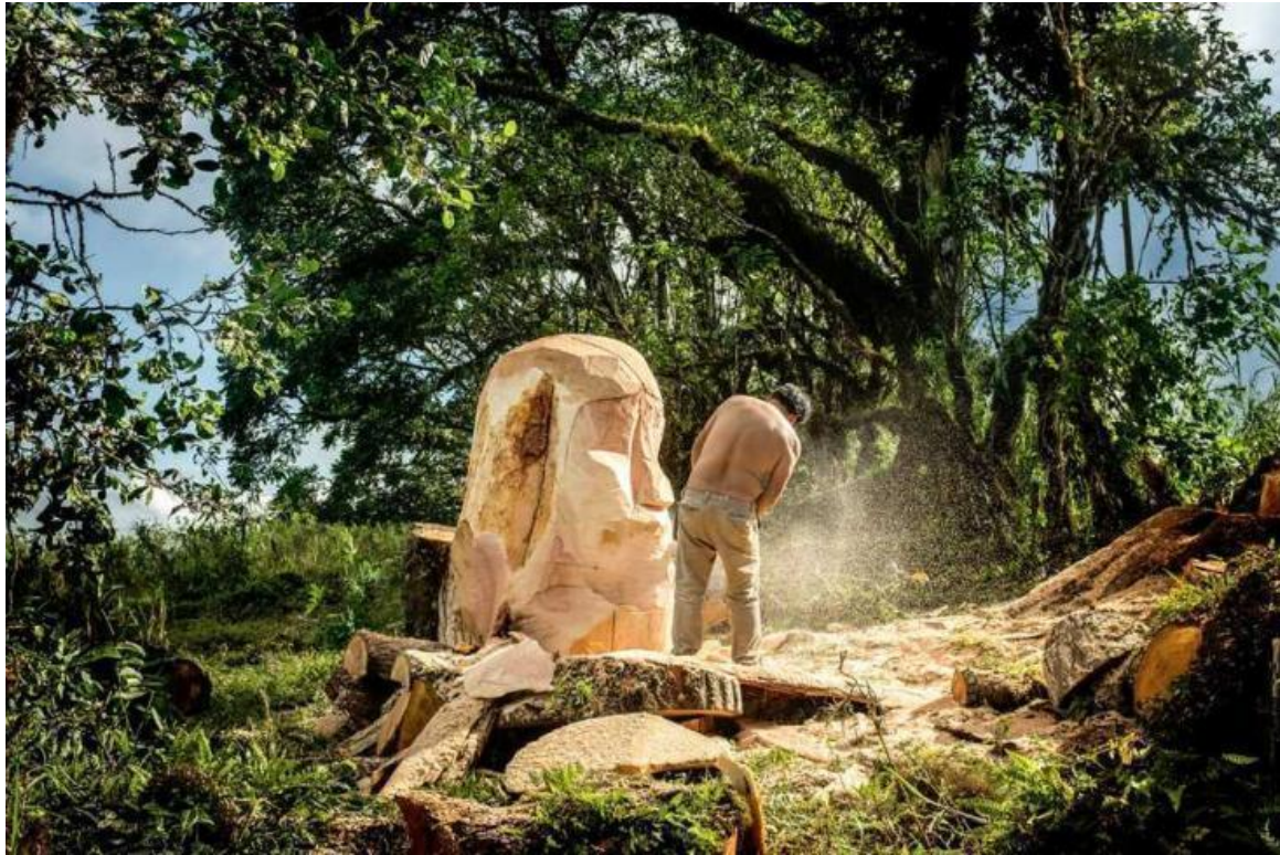
Foto 0.4 Fotograma del video “El origen de las especies introducidas”. Santa Cruz 2016.

Azuay, y residente desde hace 35 años en Santa Cruz, Islas Galápagos. La obra es producida en el marco de la residencia LARA (Latin American Rooming Art) y exhibida en el CAC (Centro de Arte Contemporáneo) Quito, en el marco del mismo programa.