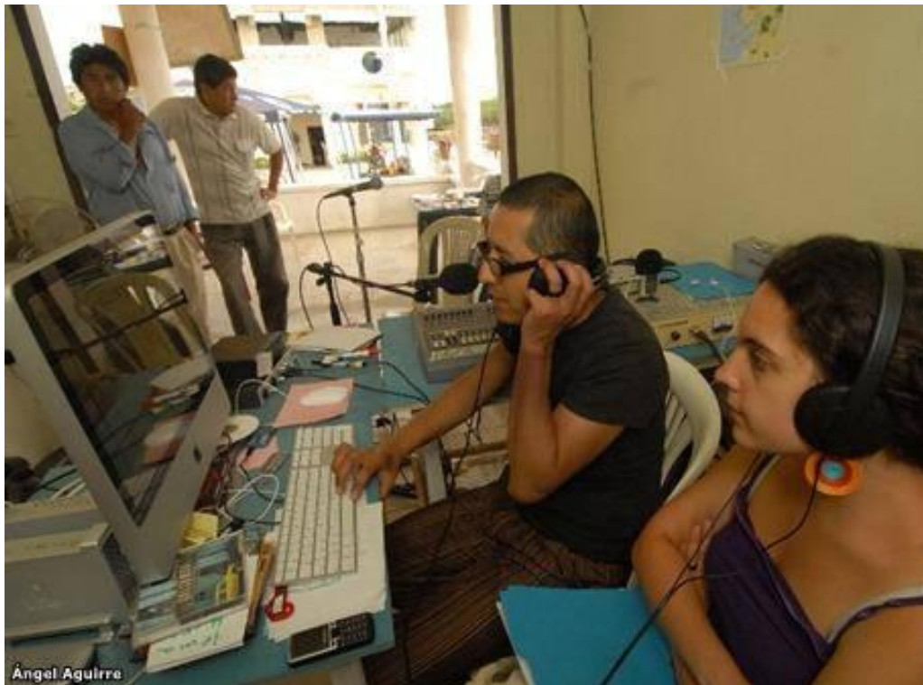
Foto 0.7 Proyecto Ondas Porteñas, en Puerto El Morro, Guayas, 2009.

expectativas con el medio porque sirvió para comunicarse con habitantes de otras zonas ( El Universo 2009).