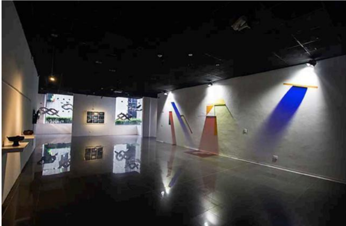
Foto 0.3 Recorrido Equinoccial, Museo Pumapungo, Cuenca 2018.