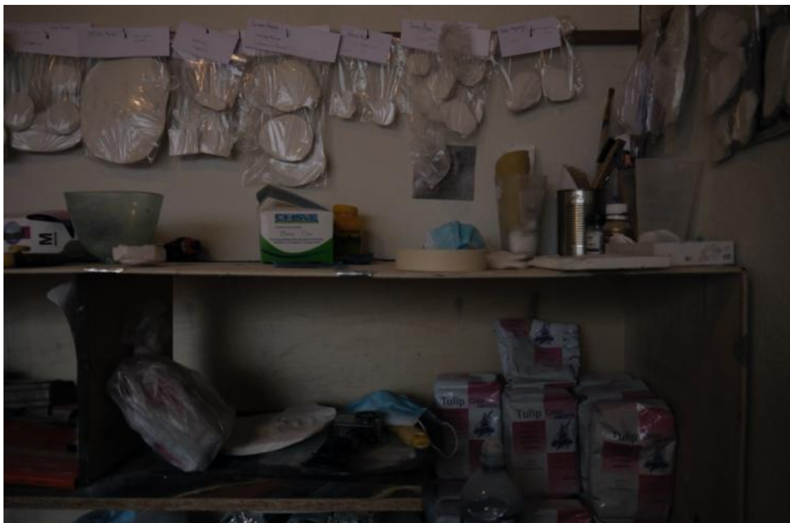
Foto 0.1 Taller de la artista, Cuenca 2018.