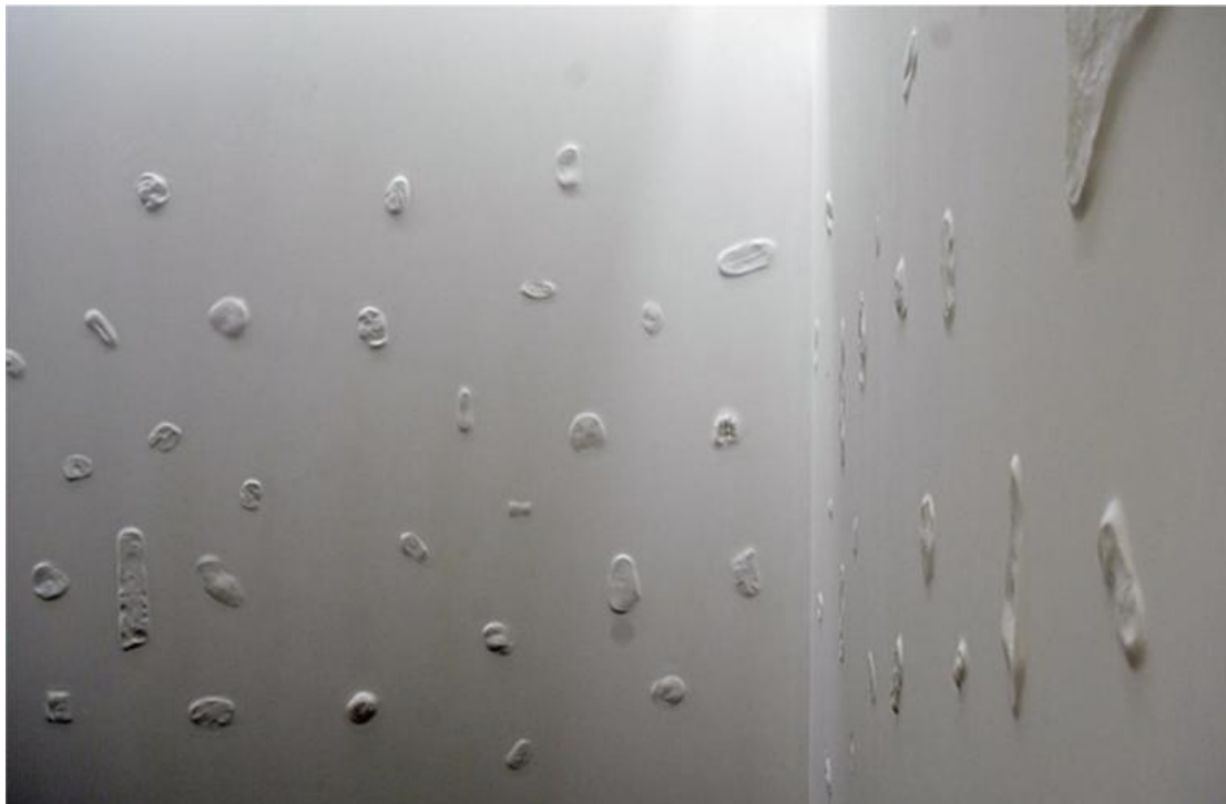
Foto 0.2 Geografías de la mortalidad, Museo de las Conceptas, Cuenca 2018.

De este modo, Vidal fue generando “un archivo” de cicatrices almacenadas en fundas plásticas. Este archivo constaba de más de 200 cicatrices de distintas partes del cuerpo, que posteriormente fueron colocadas e incrustadas aleatoriamente en varios paneles de gypsum que, pegadas a la pared, simulan paredes falsas que resaltan el relieve de las cicatrices.