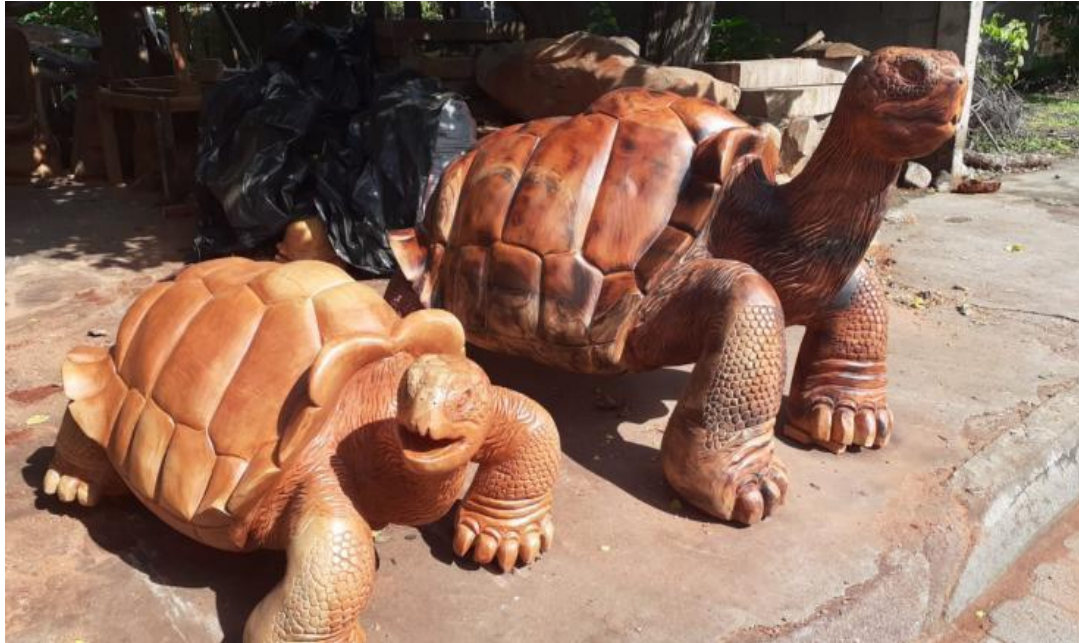
Foto 0.14 Esculturas en madera realizadas por Segundo Ruíz. Santa Cruz 2018.