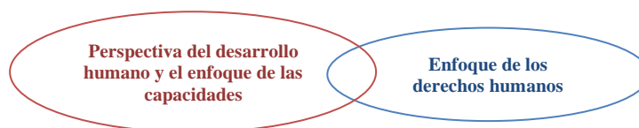
Figura 4. Enlace de las perspectivas del desarrollo humano y el enfoque de las capacidades, y los derechos humanos

oportunidades, no alcanzan como única fuente de información para pensar los derechos, debiendo considerar otras nociones vinculadas con la agencia para entender el aspecto procedimental de estos. También la autora (2018) indica que para Nussbaum los derechos, más allá de su reconocimiento legal o nominal, deben comprenderse en relación con la protección y ampliación de las capacidades humanas, examinando si las políticas públicas o acuerdos sociales aportan efectivamente al desarrollo y ejercicio de dichas capacidades. De este modo, para conseguir la capacidad de alcanzar mejores niveles de salud, no basta con reconocer el acceso a servicios de salud en normas legales, sino que se requiere que el mismo se brinde con igualdad, calidad y oportunidad, garantizando que el contexto de vida de las personas sea apropiado para lograrlo por medio de aspectos tales como nutrición, vivienda y sanidad. A diferencia de otros autores Sen y Nussbaum han teorizado sobre este asunto “ desde una noción de libertades sustantivas, donde las obligaciones negativas de no interferir se deben complementar con obligaciones positivas de hacer y proveer, lo cual implicaría por ejemplo reconocer a la lucha contra la pobreza como un derecho humano ” (Vizard, 2006 como se citó en Valencia, 2018:116).